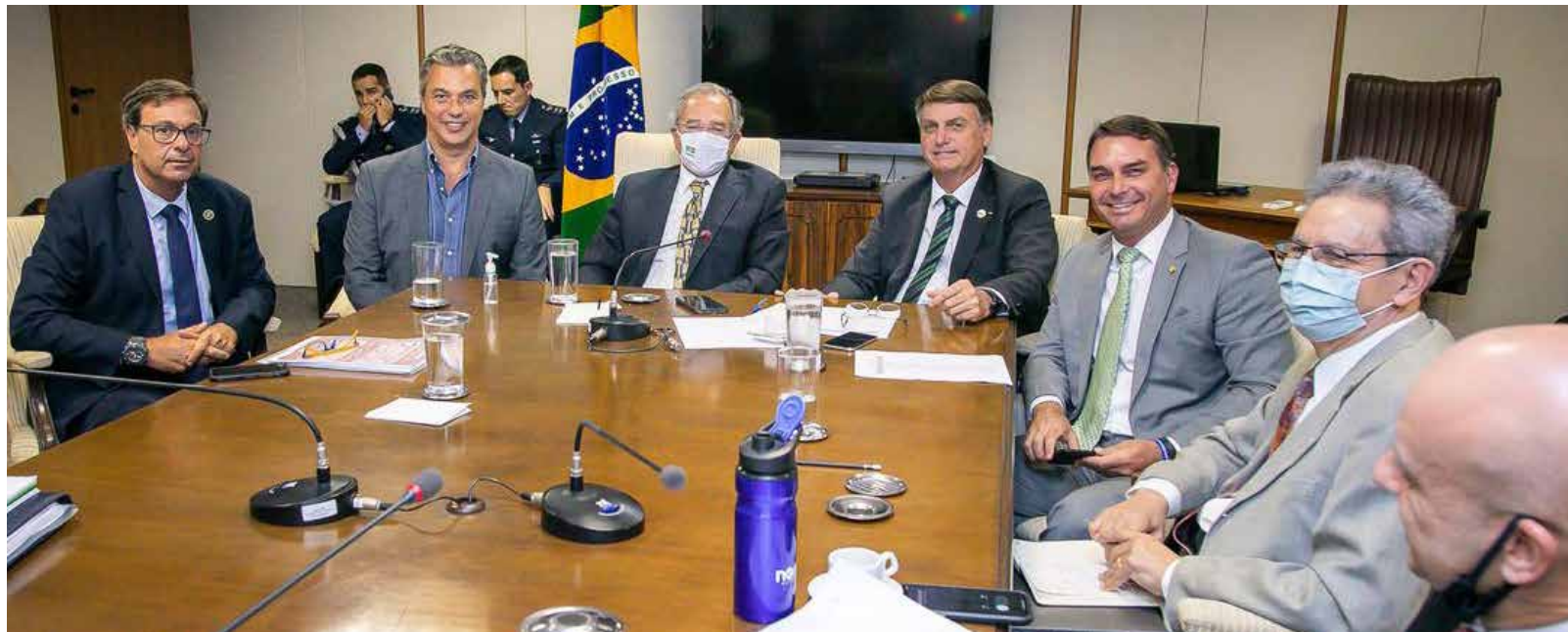
Washington Costa/Ministério da Economia

Ontem (26), a Petrobras reajustou o preço médio do diesel nas refinarias em 4,4% e há especulações sobre uma greve de caminhoneiros que aconteceria na próxima segunda-feira (1º). “A Petrobras segue uma planilha, tem a ver com preço do petróleo lá fora, tem a ver com variação do dólar. Ontem foi