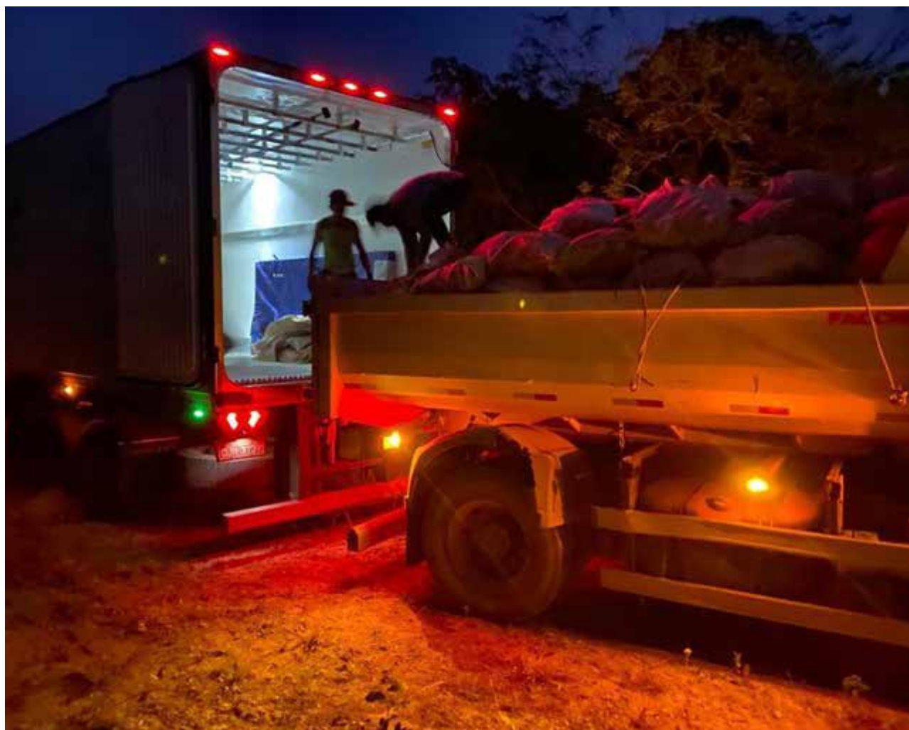
Além do impacto social positivo com a compra da produção de pequenos agricultores familiares, o projeto estimula a fabricação da bebida feita com mandioca goiana e movimenta indiretamente uma cadeia que envolve os setores do agronegócio, logística, embalagens, maquinário, publicidade, varejo, entre outros