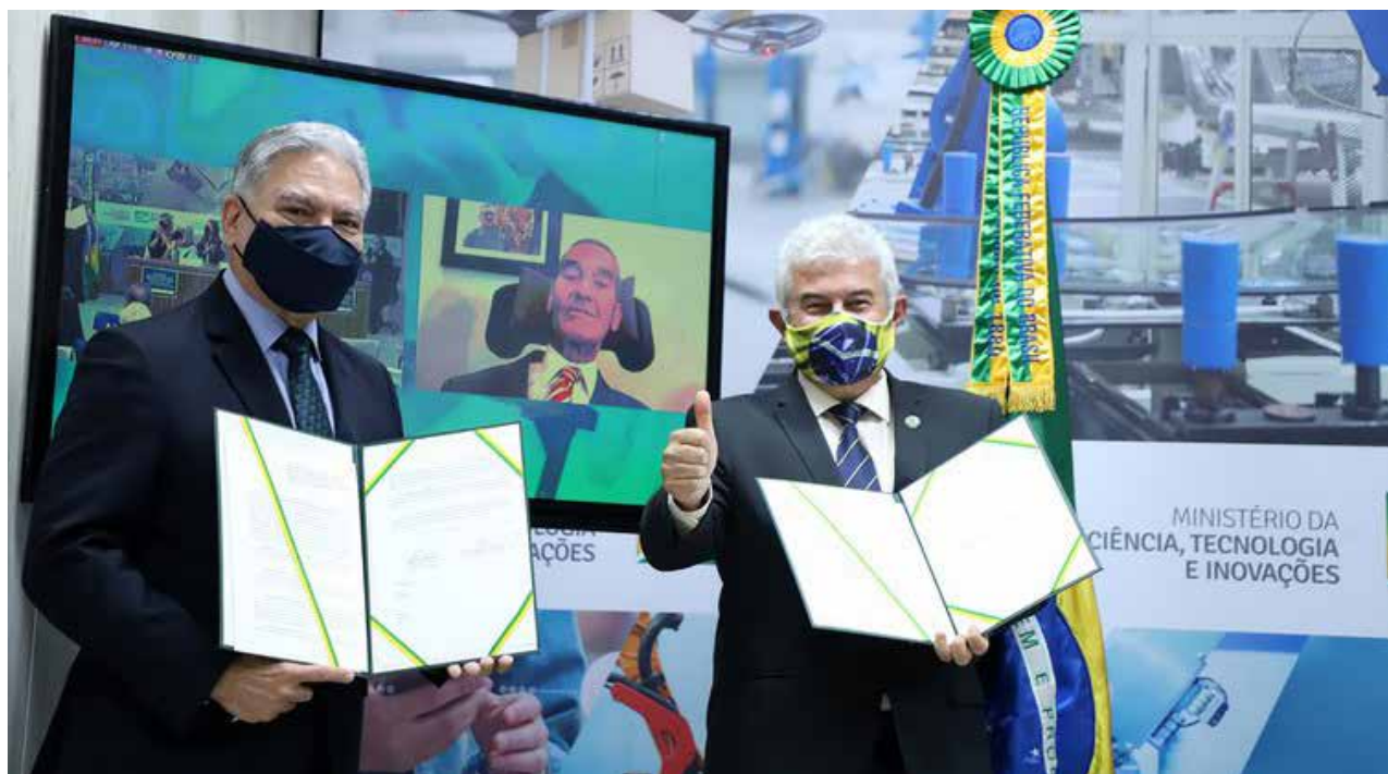
Cerimônia marcou a assinatura de um acordo com o Instituto General Villas Bôas para incentivar o desenvolvimento da tecnologia assistiva

O MCTI também assinou um acordo de cooperação com o Instituto General Villas Bôas (IGVB). A parceria prevê apoio à inovação tecnológica como forma de desenvolver tecnologia assistiva (TA), buscar investimentos e fazer com que novos itens cheguem a quem precisa deles para viver com mais conforto, dignidade e se manter produtivo. O general Villas Bôas, portador de Esclerose Lateral Amiotrófica (ELA), não pode comparecer à cerimônia por ser do grupo de risco do coronavírus, mas utilizou da tecnologia para escrever com os olhos seu discurso que foi lido pela presidente do Con-