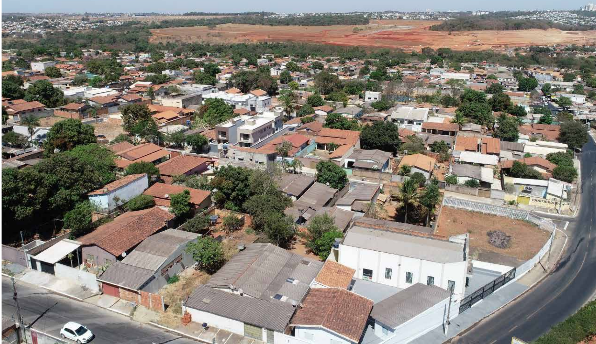
Helmert Engenharia / Sérgio William

Estimativa é beneficiar mais de 200 famílias do bairro, que nasceu por meio de ocupação de uma área do Estado de 244 mil metros quadrados. Presidente da Agehab esteve no local para acompanhar o início dos trabalhos de campo. Previsão é que parte técnica seja concluída até o final do ano