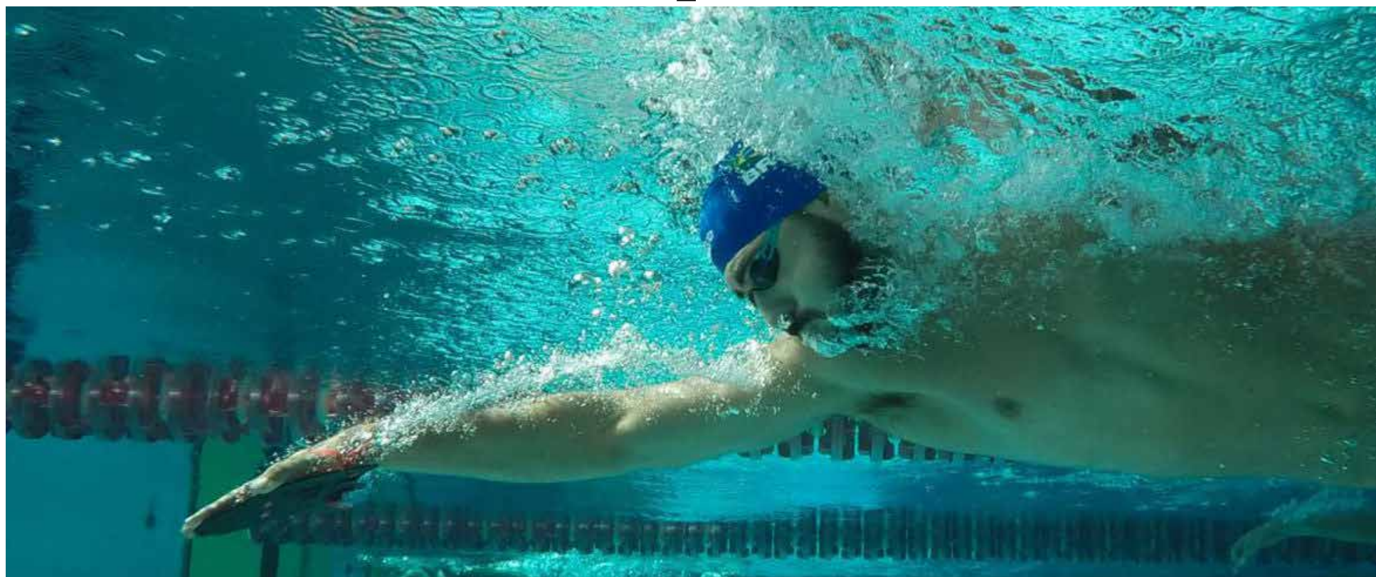
Alexandre Castello Branco/COB

Todas as provas serão disputadas em piscinas curtas