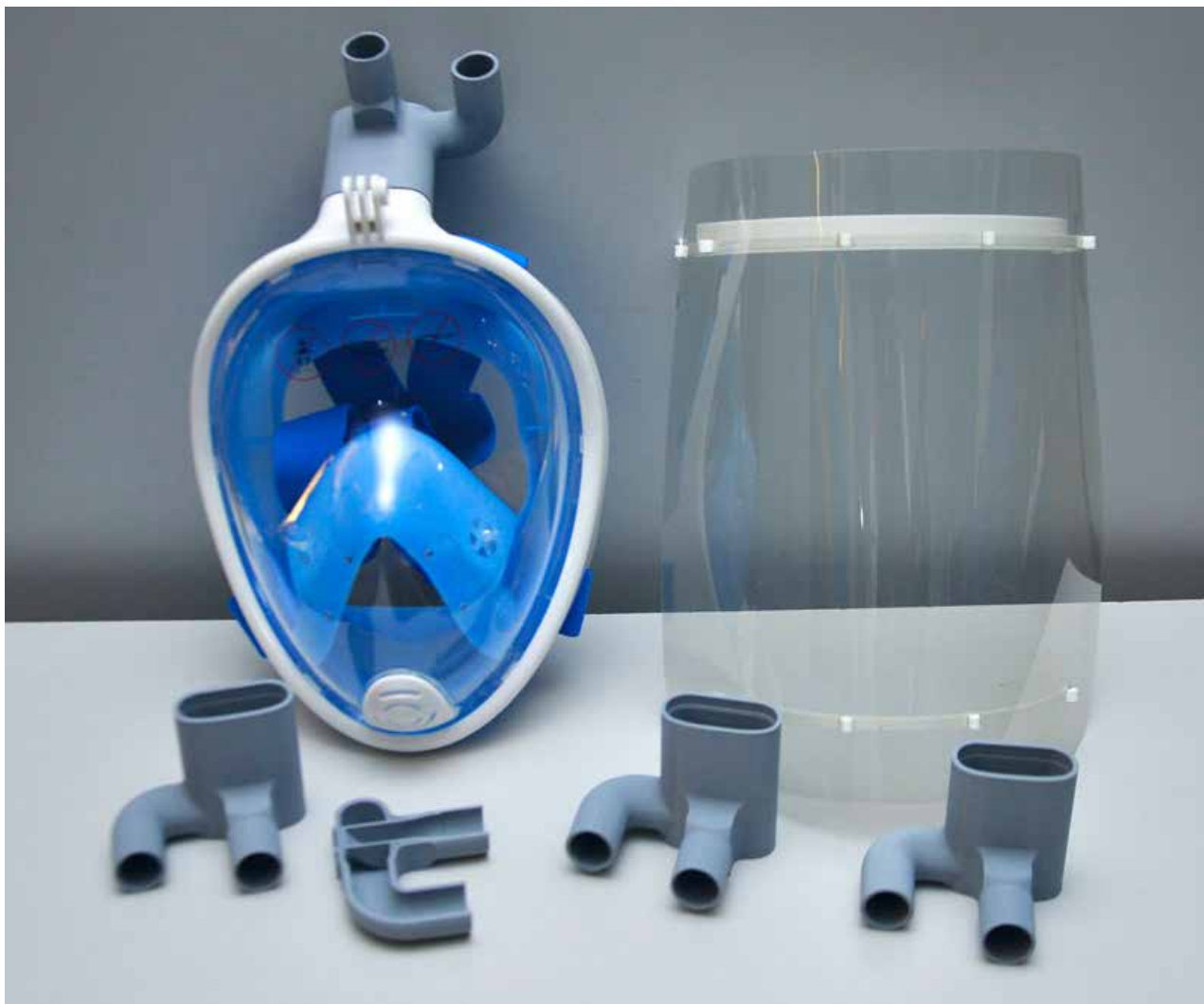
Peças impressas são acopladas nas máscaras de mergulho e também em tubos de filtragem de ar