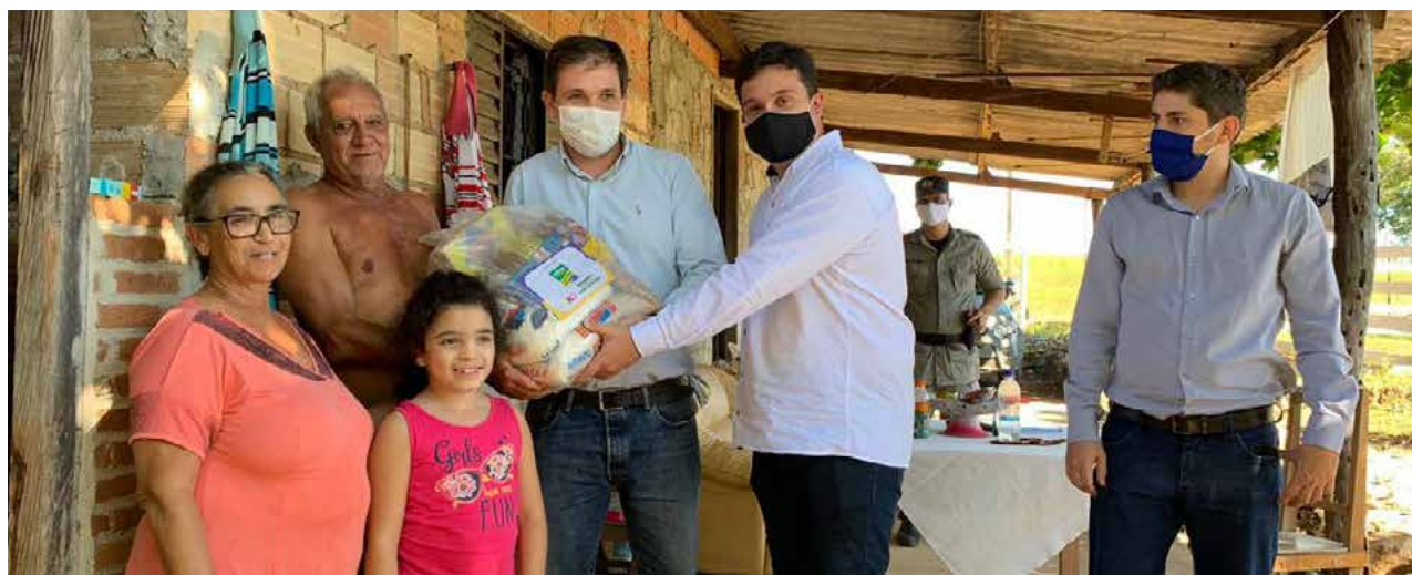
Governo de Goiás

As videoaulas que começam a ser disponibilizadas pela TV Brasil Central na próxima segunda-feira, dia 4, em parceria com a Secretaria Estadual da Educação, para os alunos da rede, e uma homenagem a todos os trabalhadores pelo 1º de maio, também foram assuntos abordados na entrevista.