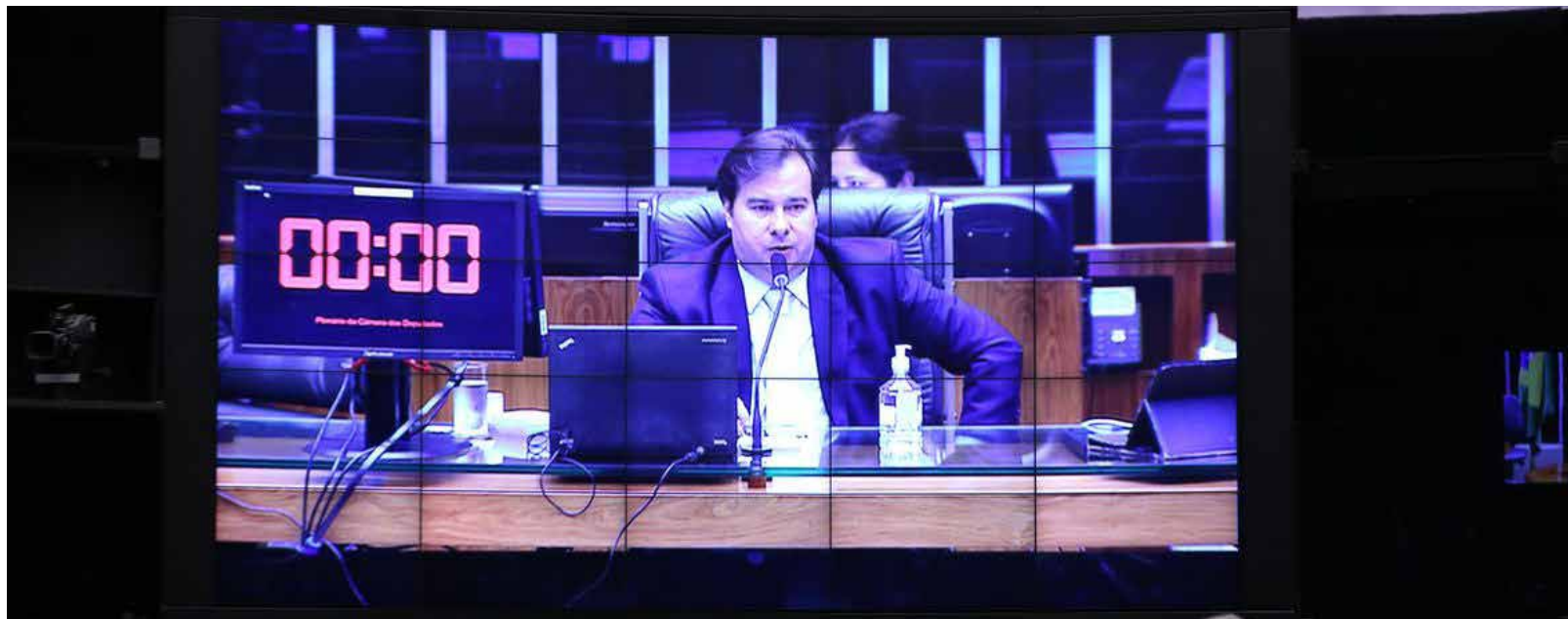
Cleia Viana/Câmara dos Deputados

As instituições financeiras estão proibidas de negar o empréstimo em virtude de restrição ao crédito por parte da empresa, inclusive protesto. O texto também proíbe a utilização dos recursos obtidos no programa para a distribuição de lucros e dividendos entre os sócios.