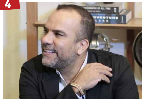
Novidades - O apresentador Jorge Neris entra no ano de 2020 com muitas novidades. A principal delas é que ele se desligou do portal NewsGo e estará lançando um novo portal de notícias no mês de fevereiro.