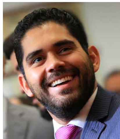
Assessoria do Vice-Governador