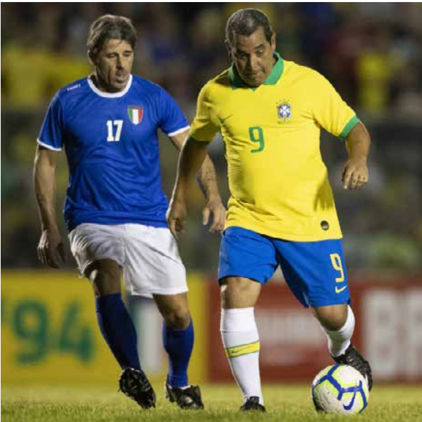
Lucas Figueiredo / CBF

com o tetracampeonato após vencer os adversários nos pênaltis, o jogo desta noite foi histórico. E o clássico foi apenas o primeiro do retorno da Seleção de Masters, uma iniciativa liderada pelo Presidente Rogério Caboclo e pela nova gestão da CBF. O grande objetivo é valorizar a história do futebol brasileiro e os craques que a escreveram. Após este primeiro compromisso com foco no Mundial de 1994, haverá uma maior variedade de gerações vestindo a camisa do Brasil.