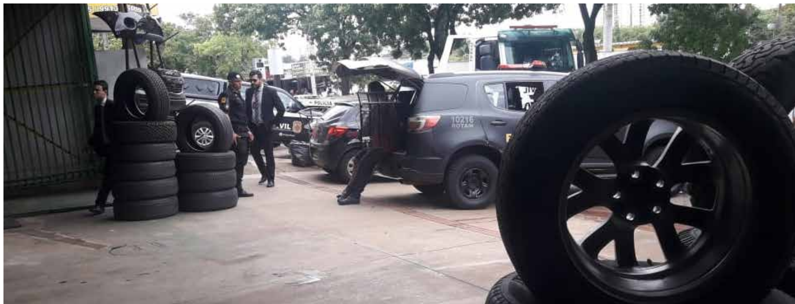
Comunicação Setorial do Detran-GO

Na ocasião, um estabelecimento que não tinha autorização de funcionamento para desmontagem e comercialização de peças foi interditado e uma pessoa foi conduzida ao Distrito Policial. O local, que fica em Aparecida de Goiânia,