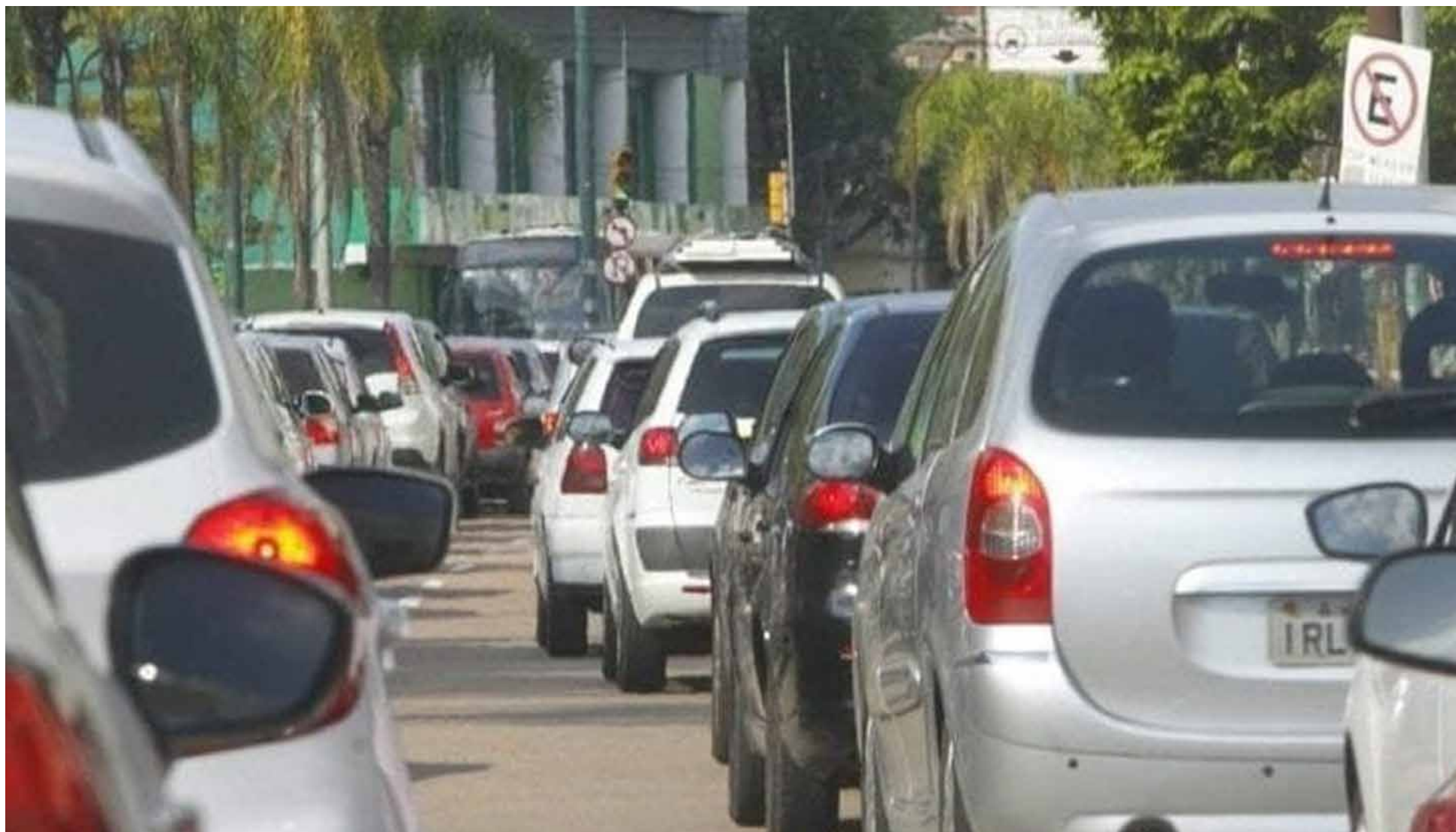
Governo de Goiás