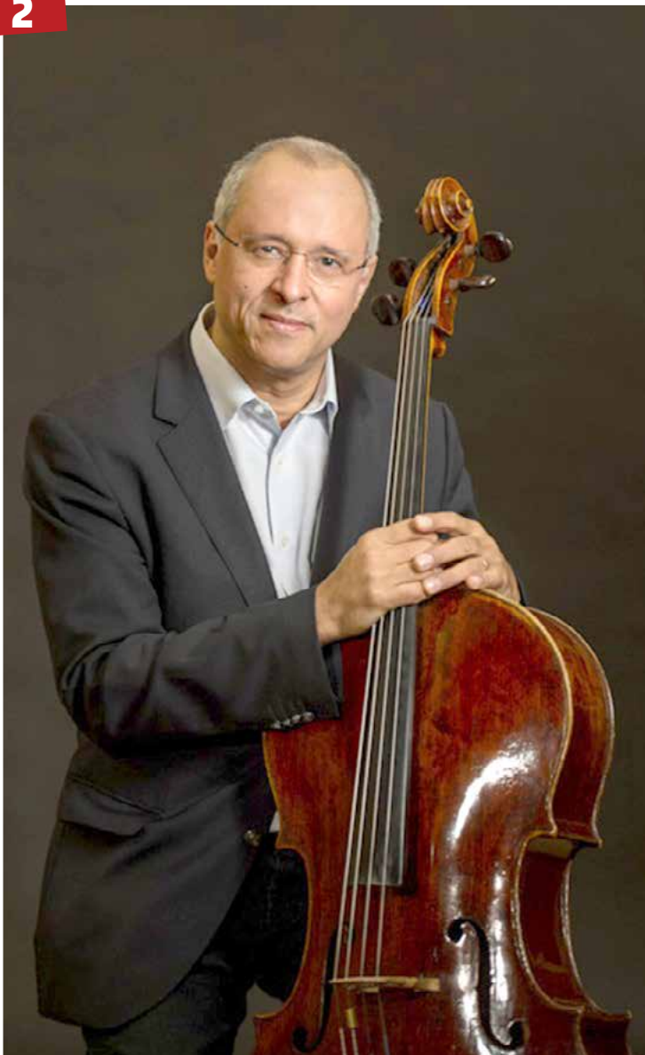
Orquestra - Nesta quinta-feira (31), o renomado violoncelista brasileiro Antonio Meneses se apresenta com a Orquestra Filarmônica de Goiás.