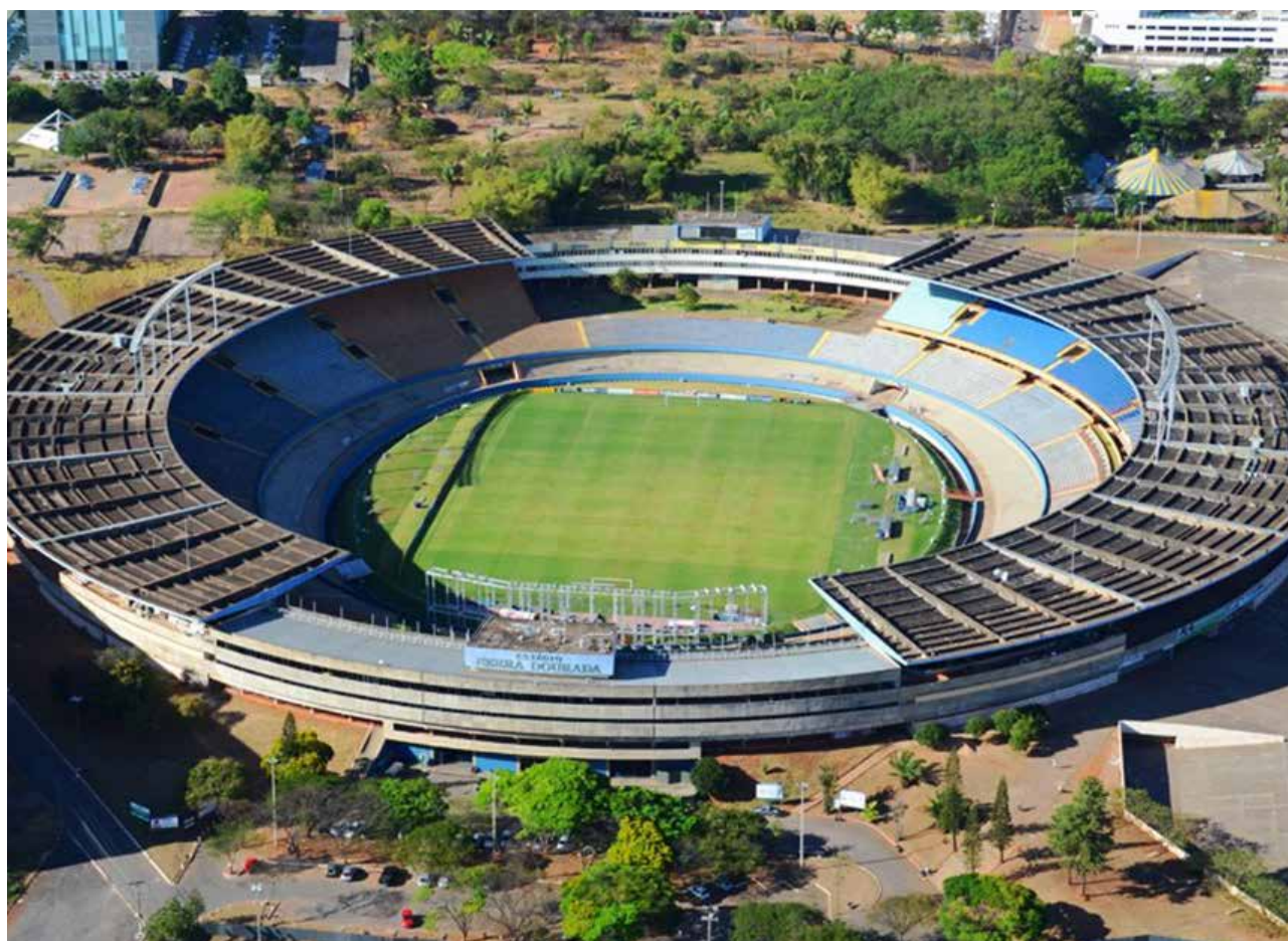
Governo de Goiás

Capacidade por setor do estádio Serra Dourada: Arquibancada: 32.657. Cadeiras: 8.914. Tribunas: 478