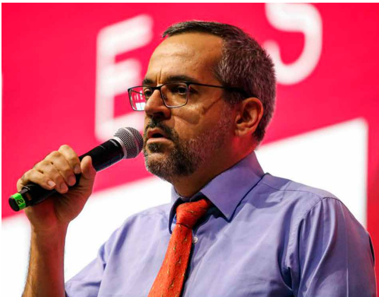
Abraham Weintraub: “Estamos administrando uma situação crítica com qualidade técnica”

Os demais recursos descontingenciados serão destinados à educa-