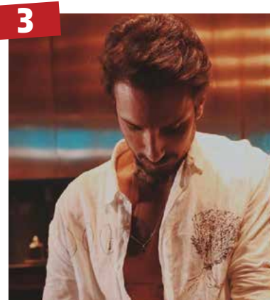
3 Baby Bordoni