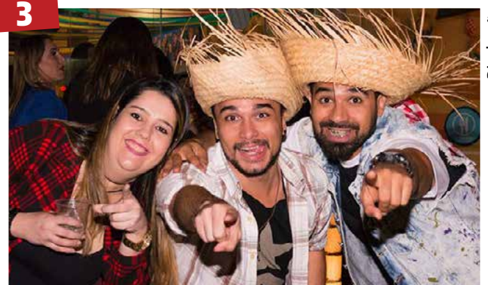
Festa Julina - O Arca Parque será palco da 4ª edição do Arraiá Bão Bisurdo, que acontece dia 20 de julho, das 18 às 00h. A festa julina é destinada tanto para os condôminos do complexo de chácaras Terra Santa como para o público em geral