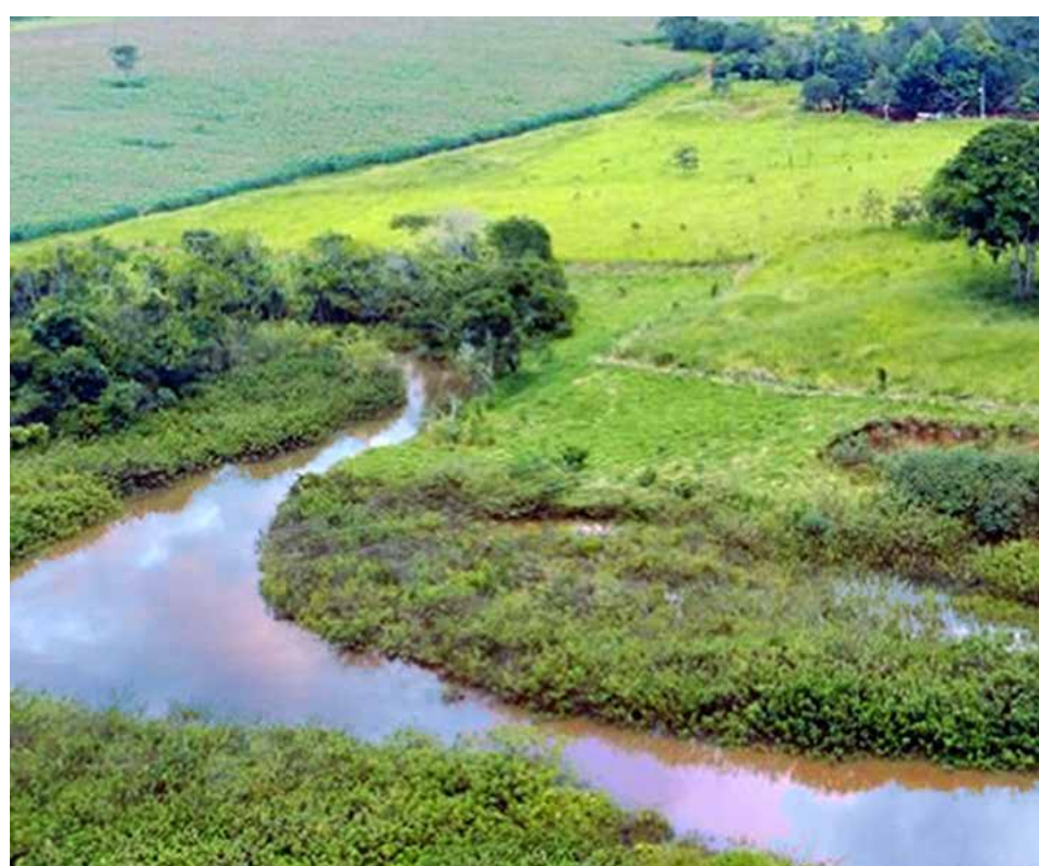
Governo de Goiás

Com as informações de todos os usuários, a Semad poderá planejar a alocação de água na bacia, promovendo uma gestão mais eficiente desse recurso em situações de escassez. O cadastro pode ser feito pelo próprio usuário no endereço: https://portal.meioambiente.go.gov.br/cadurh/login.jsp