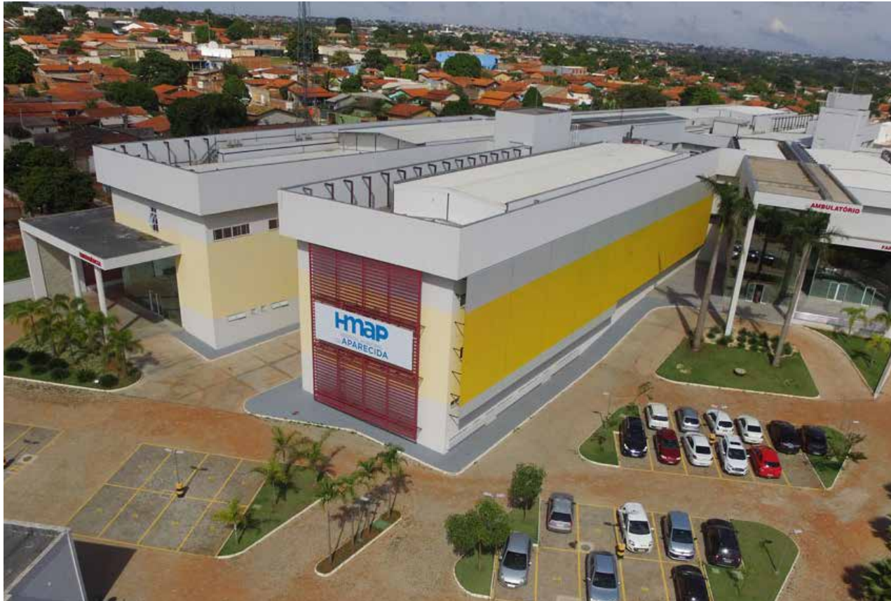
: Leonardo Faria

O convênio prevê, dentre outras iniciativas, o