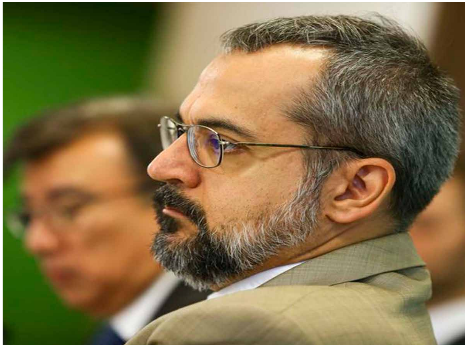
O ministro da Educação, Abraham Weintraub, durante apresentação do Compromisso Nacional pela Educação Básica, hoje, em Brasília

A intenção, de acordo com o MEC, é tornar o Brasil referência em