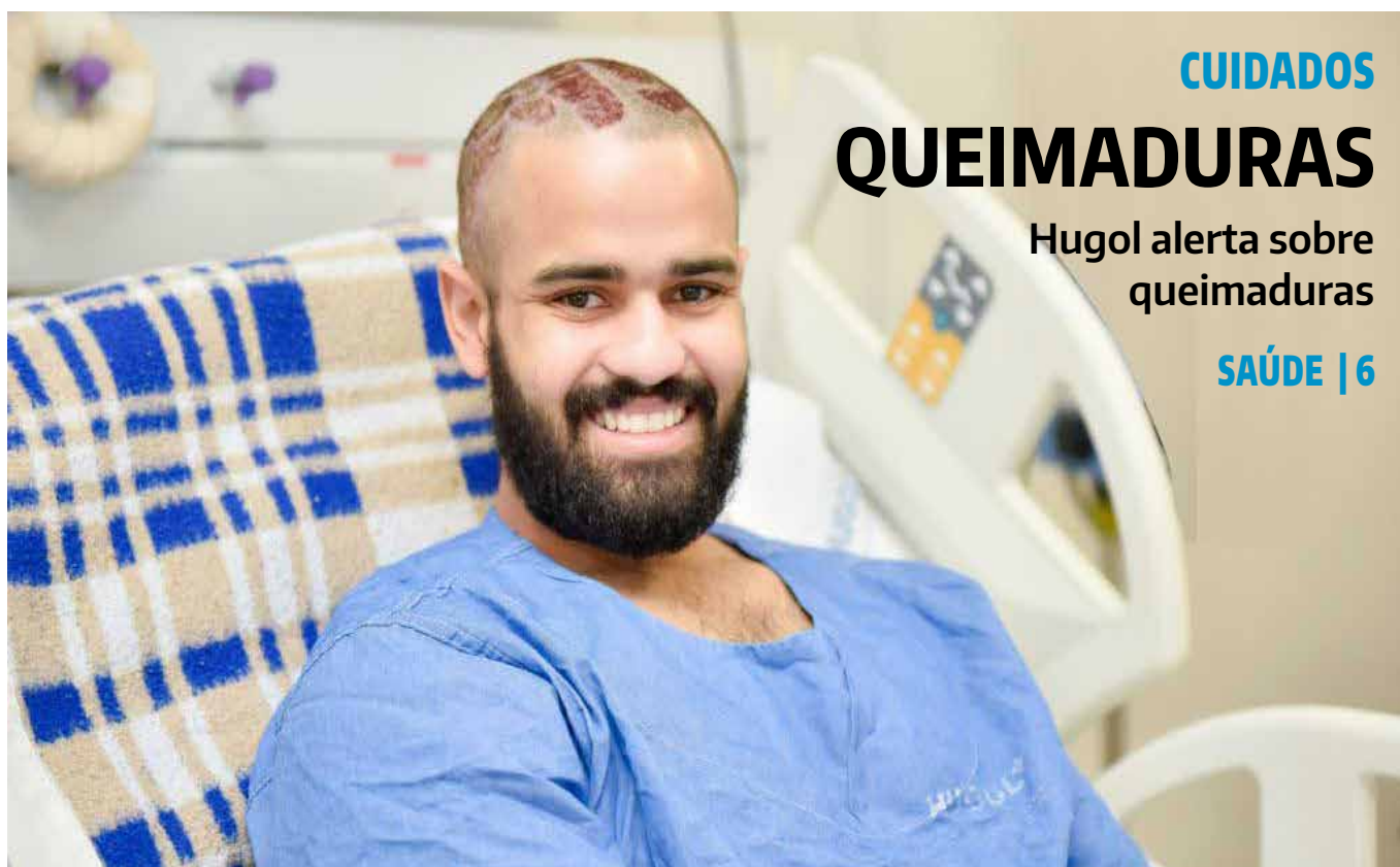
Governo de Goiás