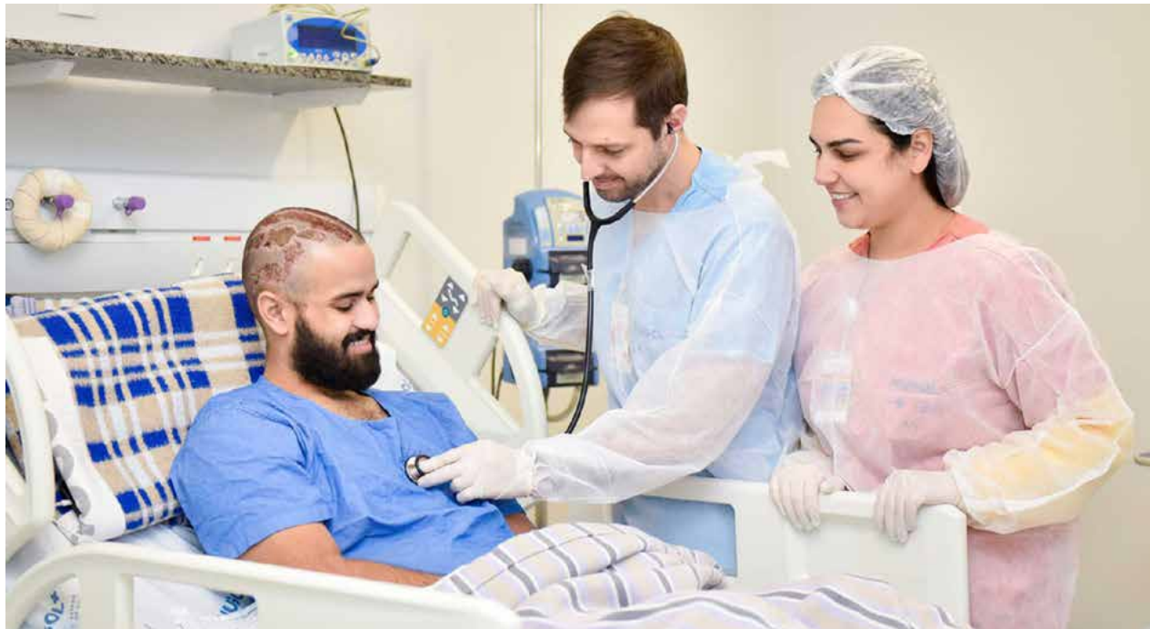
Governo de Goiás

No mês em que se comemora o Dia Nacional de Luta Contra as Queimaduras, especialistas e pacientes do Hospital Estadual de Urgências da Região Noroeste de Goiás Governador Otávio Lage de Siqueira (Hugol), unidade da Secretaria de Estado da Saúde de Goiás (SES), alertam sobre os perigos e as consequências de acidentes que resultam em queimaduras, especialmente nas festas que ocorrem no mês de junho. “Essa é uma época em que os casos de queimadura aumentam devido a acidentes com brincadeiras típicas de festas juninas, como pular fogueira ou soltar balão e fogos de artifício. As férias escolares