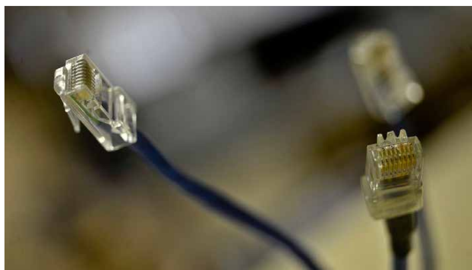
MARCELLO CASAL JR

Empresas menores, denominadas pela Agência de Prestadoras de Pequeno Porte (PPP), garantem a conectividade de 8,57 milhões de domicílios, controlando 27% do mercado. Essas firmas são aquelas cujo serviço não chega a mais de 5% do mercado de varejo. Nos 12 meses analisados, elas ampliaram sua base de usuários em 14%.