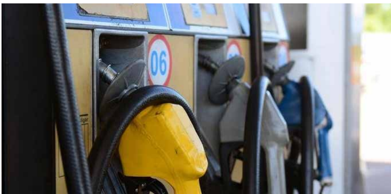
Guilherme Testa / CP Memória

A lista completa dos preços praticados nas refinarias pode ser conferida na página da empresa na internet.