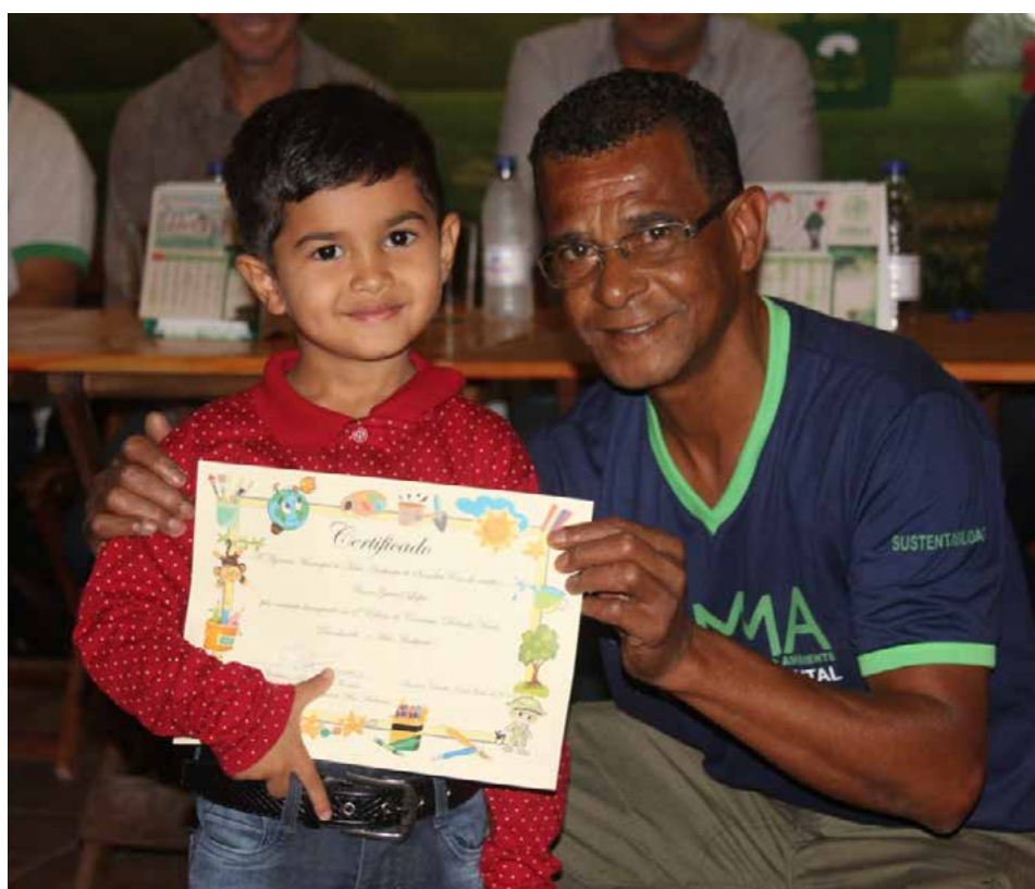
Prefeitura de Senador Canedo