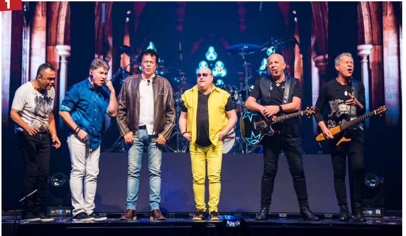
Roupa Nova – A banda Roupa Nova faz show especial para Dia dos Namorados em Goiânia, o encontro dos Namorados será no próximo dia 14, no Atlanta Music Hall.