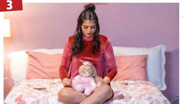
Cara de Boneca – Após o hit “Bandida Honesta”, “Cara de Boneca” é o novo single da cantora Júlia Moratto de 19 anos. O vídeo foi lançado oficialmente, nas plataformas digitais da artista.