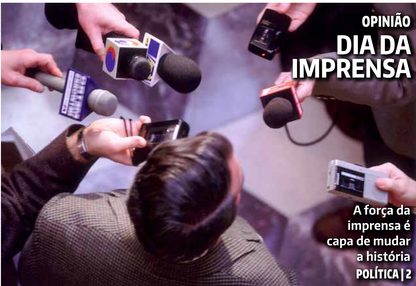
Prefeitura de Goiânia