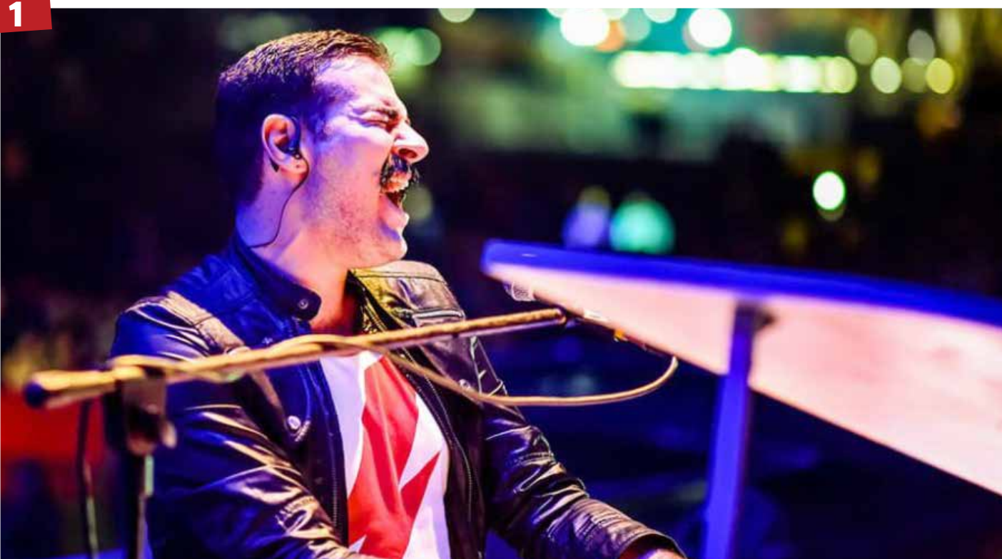
1 Queen - O Teatro Rio Vermelho receberá na noite deste domingo, às 21h do dia 9 de junho, o espetáculo "Queen Experience In Concert".