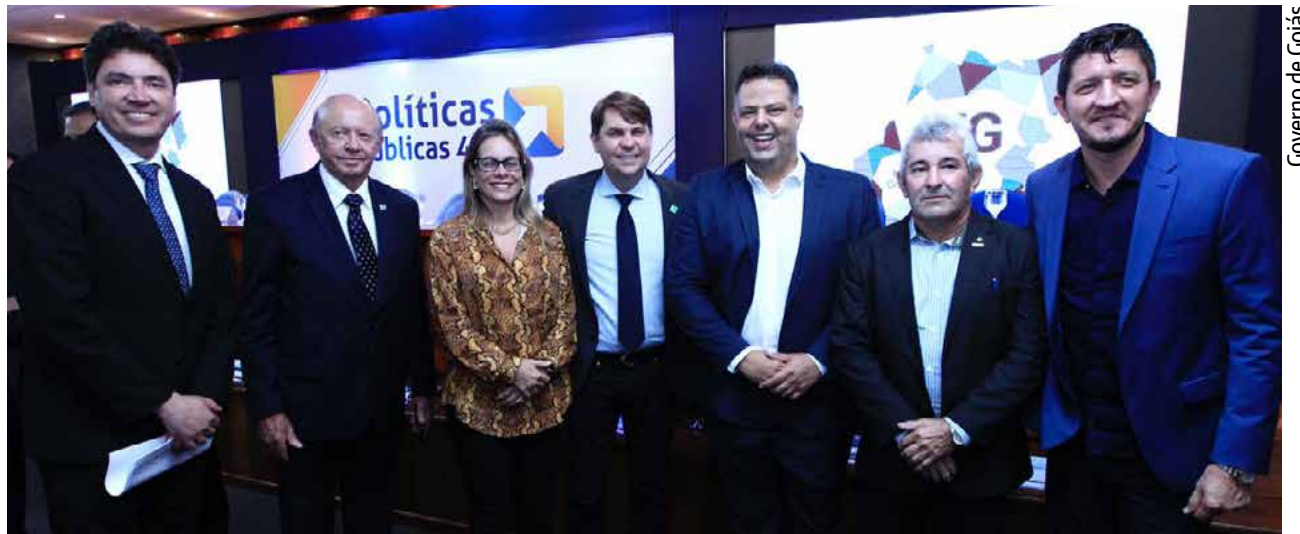
Governo de Goiás

Indústria, Comércio e Serviços Wilder Moraes colocou a pasta à disposição do setor. O titular da SIC apresentou os programas da secretaria que podem contribuir com o projeto de desenvolvimento do ramo varejista. Wilder Moraes reafirmou a parceria com os empresários goianos. "A Secretaria de Indústria, Comércio e Serviços tem gerências que contemplam todo o setor produtivo e estamos à disposição do empresário para ajudar. Em Goiás o governo não vai ser problema para o empresário. No nosso Estado o governo vai trabalhar para levar a solução para os problemas que surgirem na vida empresarial de vocês", disse o secretário.