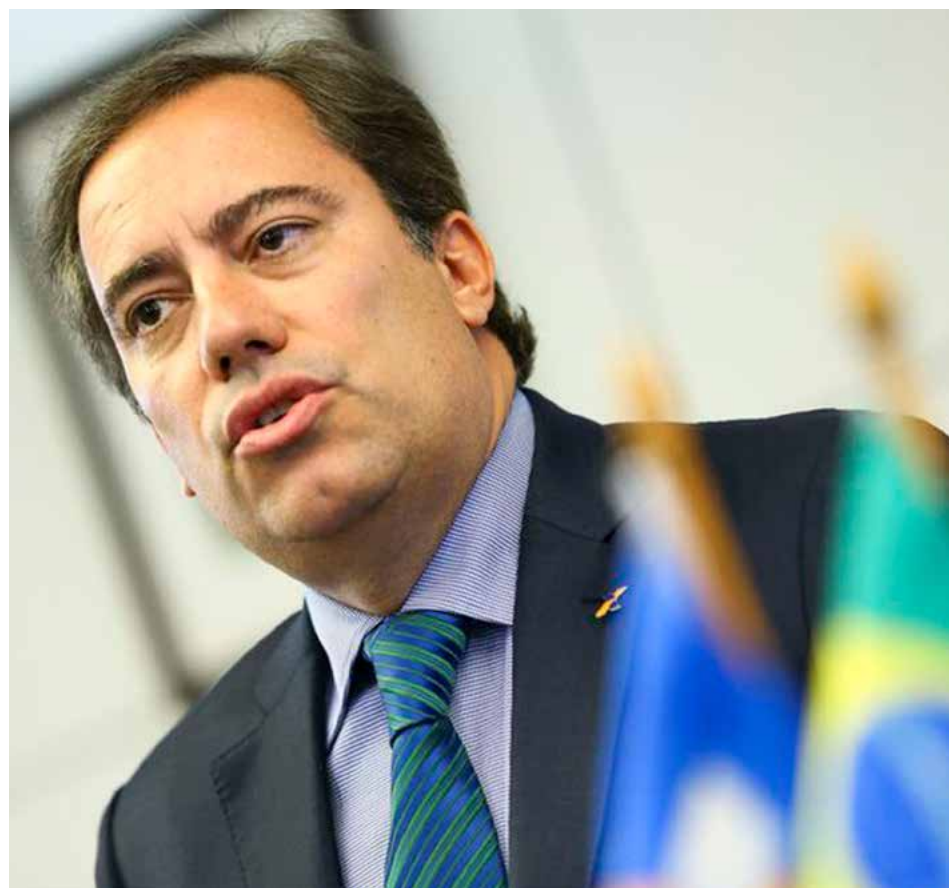
O presidente da Caixa Econômica Federal, Pedro Guimarães, durante entrevista coletiva para apresentar detalhes da campanha de renegociação de dívidas “Você no Azul”

A Caixa vai oferecer ainda o atendimento em cinco caminhões em grandes cidades, fará contato com clientes por meio de empresas de recuperação de crédito e enviará mensagens a celulares de clientes.