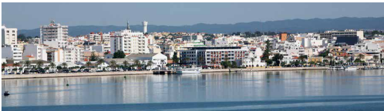
Prefeitura Municipal de Portimão

O Estádio Municipal de Portimão foi inaugurado em 1937, esbanja o charme do Algarve, e recebe com orgulho os alvinegros da cidade. O gramado ostenta um verde de dar inveja a grandes estádios pelo mundo, e foi eleito o melhor de Portugal em 2018.