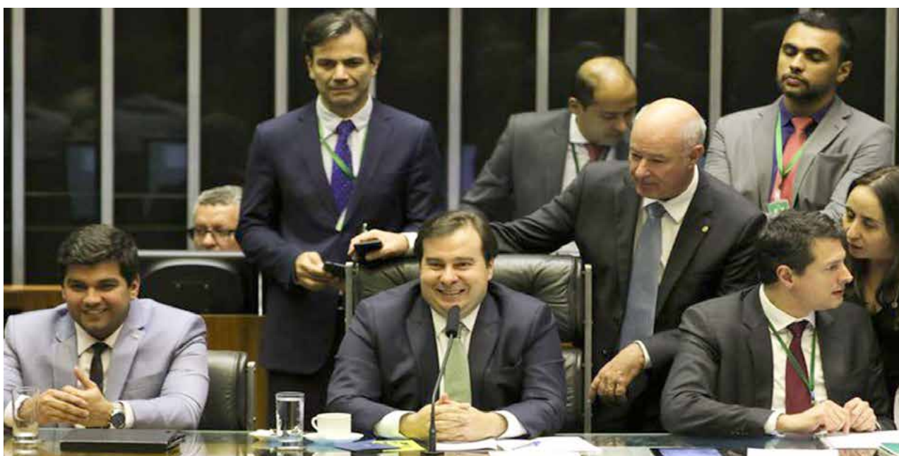
O presidente da Câmara dos Deputados, Rodrigo Maia, durante sessão plenária que aprovou o projeto de lei de conversão da Medida Provisória 870/19

Antes, no início da noite, o plenário aprovou o texto-base da MP 870/19. Os deputados aprovaram o texto da comissão mista que analisou a matéria e que devolve para o Ministério da Economia o Conselho de Controle de Atividades Financeiras