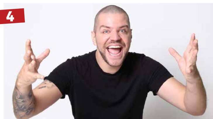
Stand up - Goiânia receberá no dia nove de maio o stand up show de um dos maiores comediantes do Brasil no momento, Victor Sarro no Guardians Empório Pub.