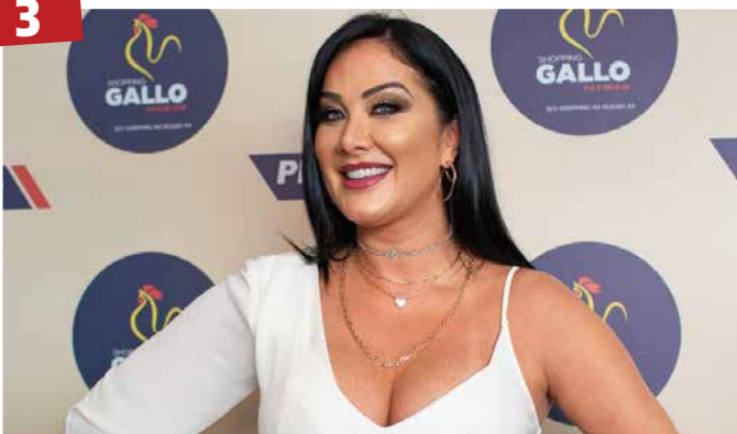
Beleza - Entre as celebridades mais cotadas para marcar eventos, a modelo e apresentadora Helen Ganzarolli estará em Goiânia neste sábado (13) para esbanjar beleza na inauguração do novo stand do Shopping Gallo.