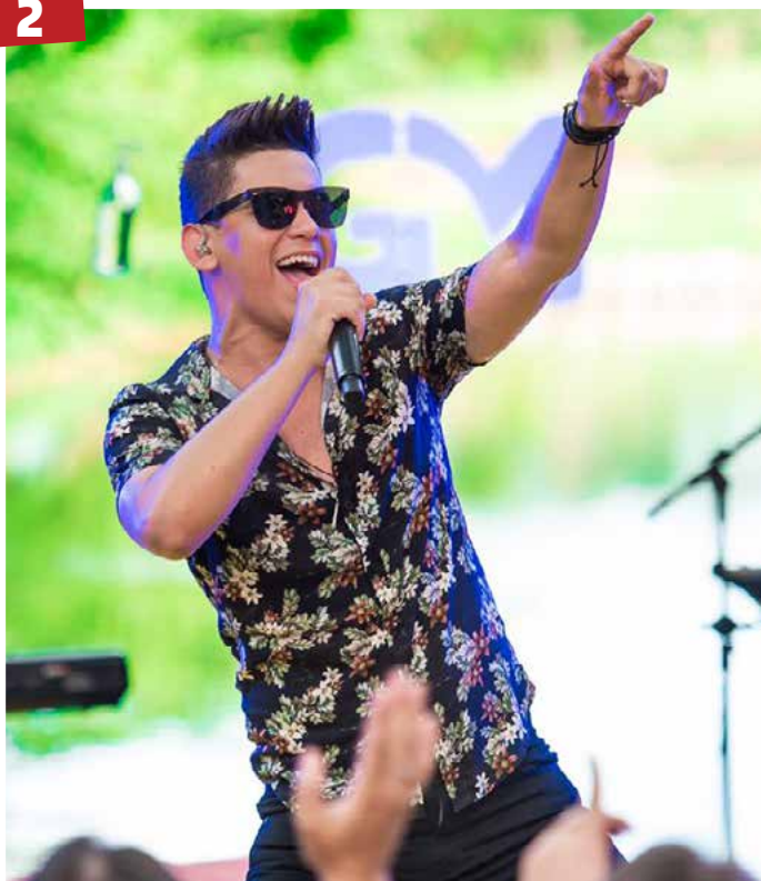
Nova música - O cantor sertanejo Gabriel Mendes entrega mais um trabalho de sucesso com Imagina O Grau Que Eu Tô. A faixa inédita, que foi lançada na última terça-feira (02), tem um início inovador e desenvolve com a batida perfeita para dançar.