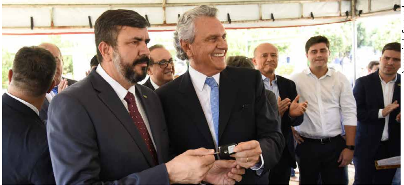
Assessoria do Governador

O governador criticou o fato de a Constituição Brasileira definir um percentual específico de investimentos para a Saúde e a Educação, mas não garantir nada para a Segurança Pública. Quando senador, Caiado foi autor do projeto que visa destinar parte da arrecadação do dinheiro das lotéricas para a Segurança Pública. “Com isso, nós podemos criar a mesma situação da Educação e da Saúde, e garantir um repasse fundo a fundo para que o secre-