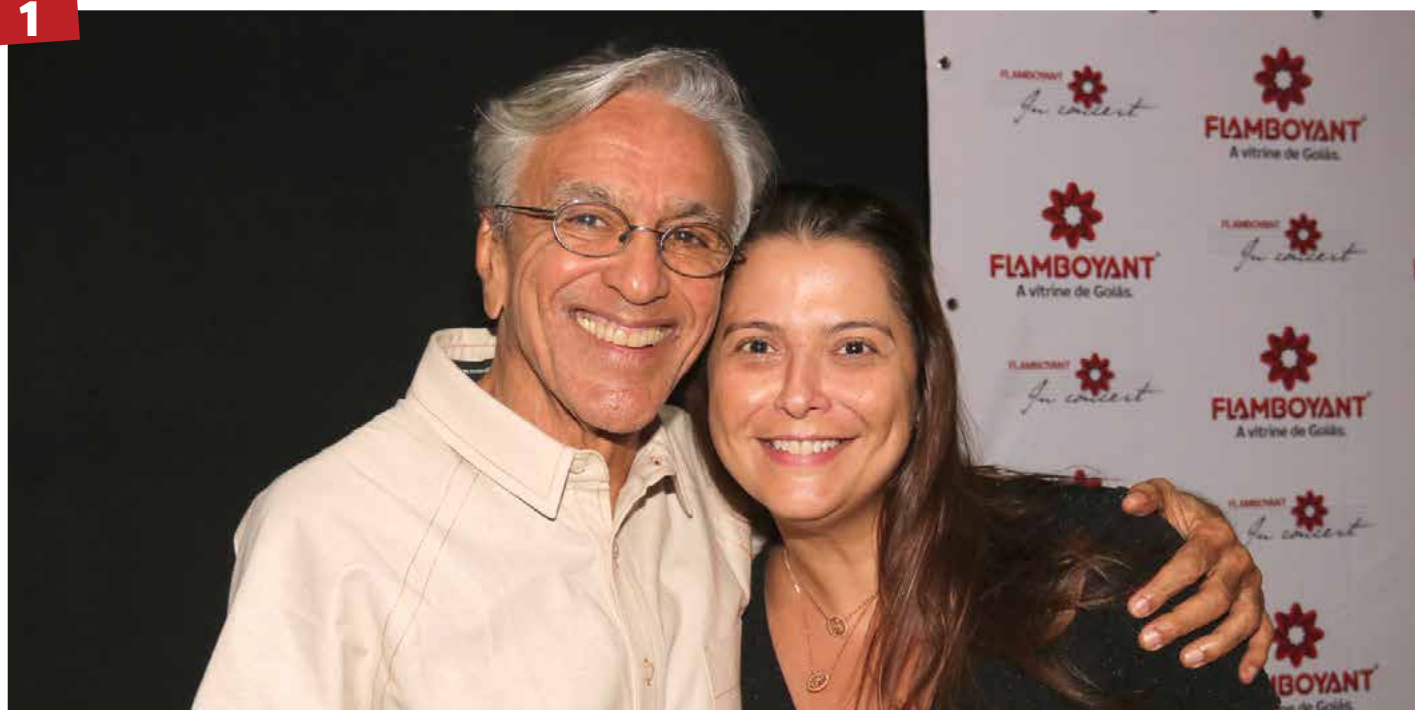
Show - Caetano Veloso abriu a temporada 2019 do Flamboyant In Concert, no dia 26 de março. Ele fez um show de voz e violão repleto de grandes sucessos de sua carreira e fez foto com a gerente de marketing do Flamboyant, Aline Guedes.