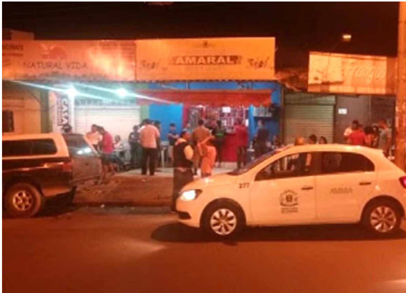
Prefeitura de Goiânia

Conforme as reclamações forem chegando ao telefone 161 da Amma, fiscais do órgão e policiais ambientais se dirigirão ao local em viaturas distintas. Uma estrutura foi montada para apreensão de aparelhagem de som e carros com som auto-