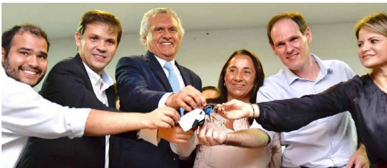
Assessoria do Governador

A avaliação de Caiado como deputado, senador, e agora governador, é a de que “a democracia não é paz de cemitério, é efervescente, é debate, credibilidade e transparência”, e que a realidade vivida em Goiás é síntese do