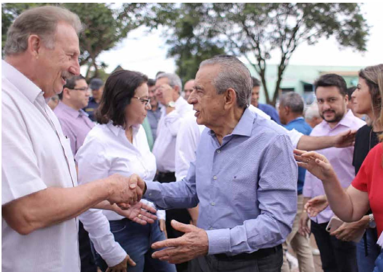
Prefeitura de Goiânia

Durante o evento, o prefeito de Goiânia, Iris Rezende, entregou uma praça no Setor São Judas Tadeu e o recapeamento da rua Santana, no Jardim Pompéia, além de vistoriar obras no Parque Nova Morada, no Residencial de mesmo nome, que são realizadas em parceria com a Universidade Federal de