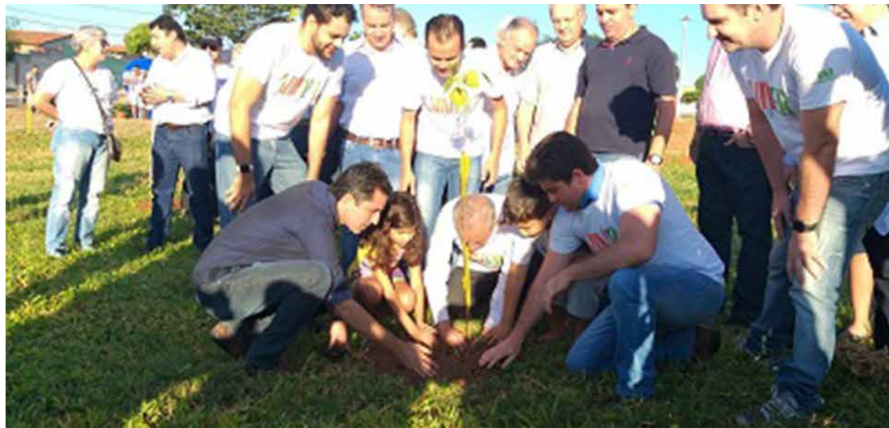
Prefeitura de Goiânia

A ação também contou com a equipe de 'Educação Ambiental Pelos Parques', parceria entre a AMMA e SME, com trabalho na