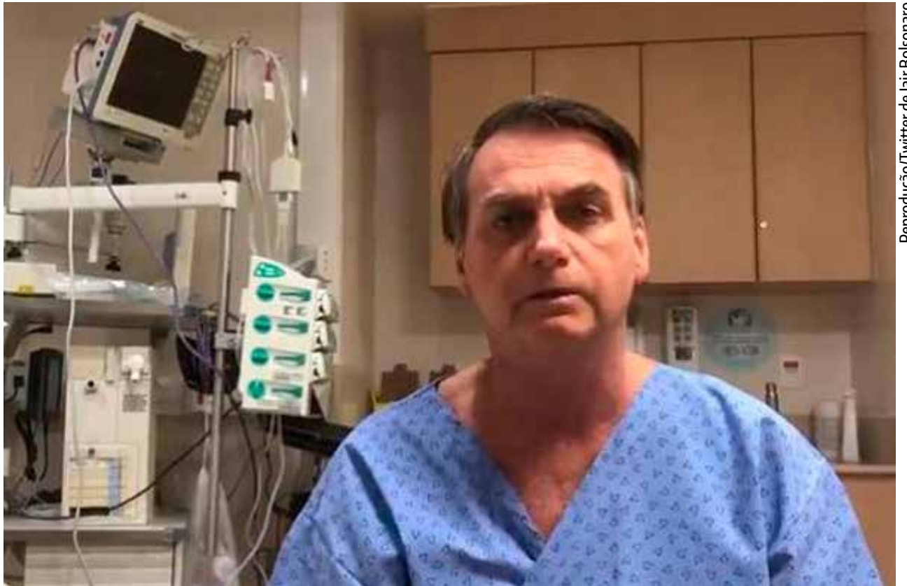
Presidente Jair Bolsonaro passará por cirurgia nesta segunda-feira (28) para retirada de bolsa de colostomia

Bolsonaro foi esfaqueado em um ato de campanha, em Juiz de Fora, no dia 6 de setembro. A facada atingiu o intestino e o então candidato foi submetido a duas cirurgias, uma na Santa Casa de Juiz de Fora e outra no Hospital Albert Einstein, em São Paulo. A bolsa de colosto-