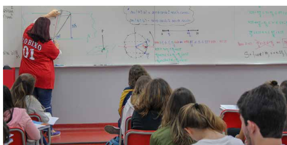
Gabriel Mialchi/Oficina do Estudante

O resultado da seleção está mantido para segunda-feira (28), conforme calendário divulgado anteriormente.