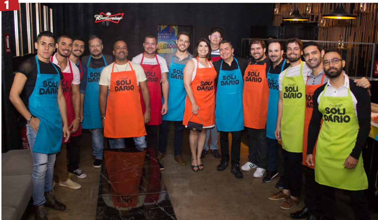
Solidário - Nas edições do The Pub Solidário, personalidades goianas se tornam bartenders por uma noite, servindo os clientes que fizeram doações e a próxima edição acontece sábado (19).