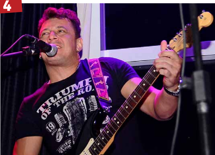
Rock Com mais de cinco anos de existência, a banda de rock clássico, Stone Age Trio, se apresenta nesta sexta-feira (4/1) no pub Mr. Hoppy.