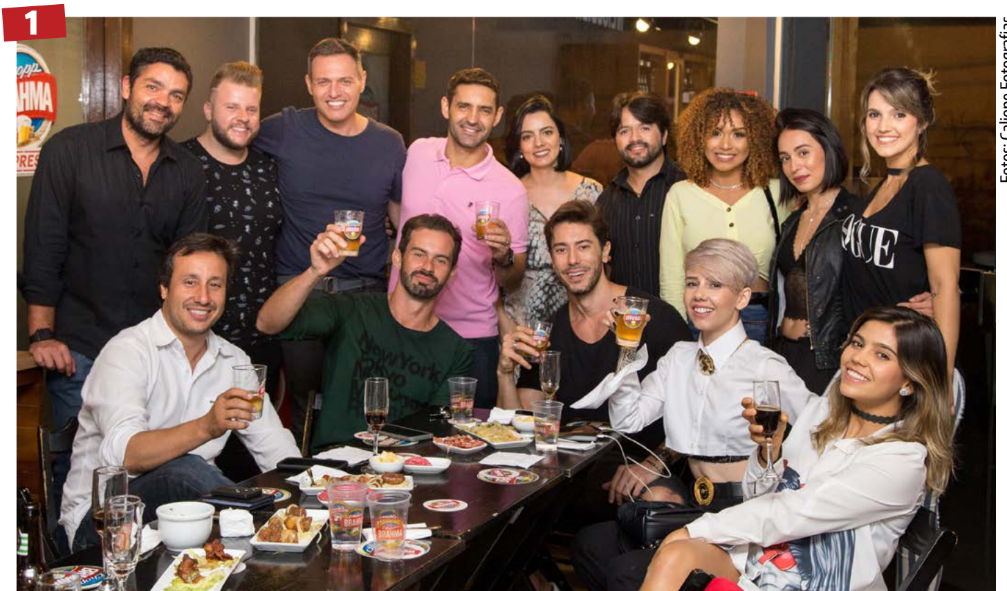
Convidados - Os convidados para a degustação de cervejas artesanais do Chopp Brahma Express.

A programação traz uma grande diversidade de ritmos: Pop Rock, Rock Nacional e Internacional, Sertanejo, MPB, Black Music, Samba, Hip House, Reggae, Anos 70, 80 e 90, e Música Eletrônica. Todas as apresentações são gratuitas e abertas aos hóspedes.