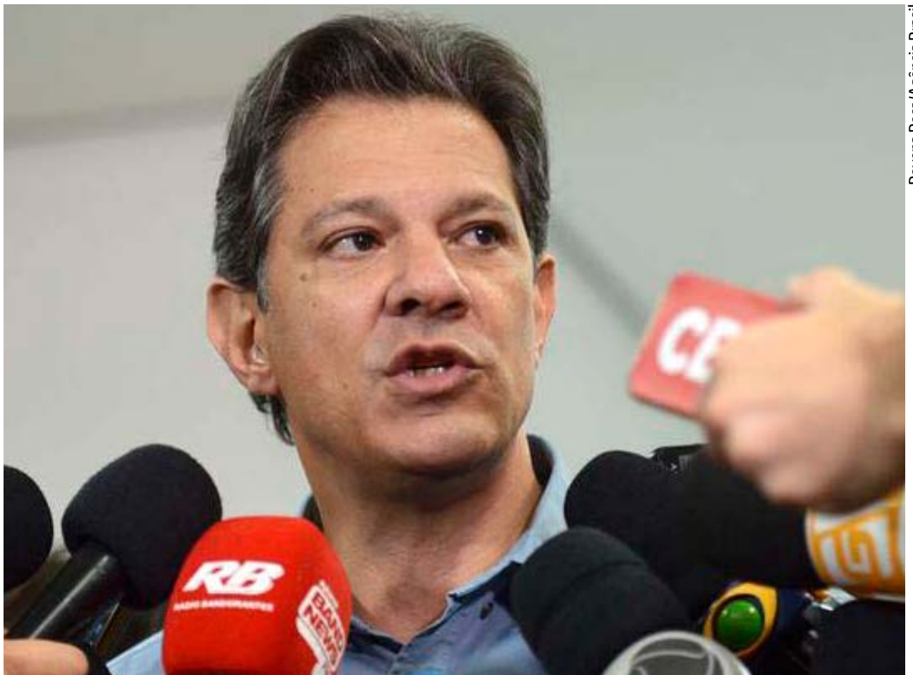
O candidato à presidência da República, Fernando Haddad, fala com a imprensa no hotel Matsubara

Haddad também comemorou a decisão do Tribunal Superior Eleitoral (TSE) que ordenou a remoção de seis postagens de Bolsonaro no YouTube e no Facebook que criticam o livro “Aparelho Sexual e Cia.” e dizem que a obra foi distribuída a escolas públicas no período em que candidato do PT, Fernando Haddad, comandava o Ministério da Educação. “Apesar do atraso, ficamos felizes que o tribunal eleitoral tirou do ar o vídeo em que o Bolsonaro me acusa de distribuir material impróprio para crianças de seis anos. É uma luta de anos que foi vencida ontem”, destacou o candidato ao