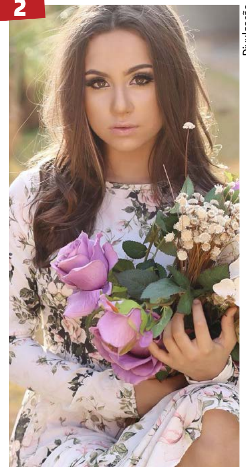
Mães e filhos - O MOS, Organic Hair Spa, preparou um dia especial no mês de Outubro para as Mães e filhos, com a participação da cantora, compositora, atriz e ex-participante do The Voice Kids.