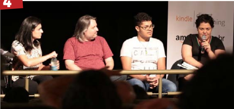
Cultura - A Amazon Brasil e o Centro Municipal de Cultura Goiânia Ouro, promoveram a “Noite do Autor Independente” na capital de Goiás.