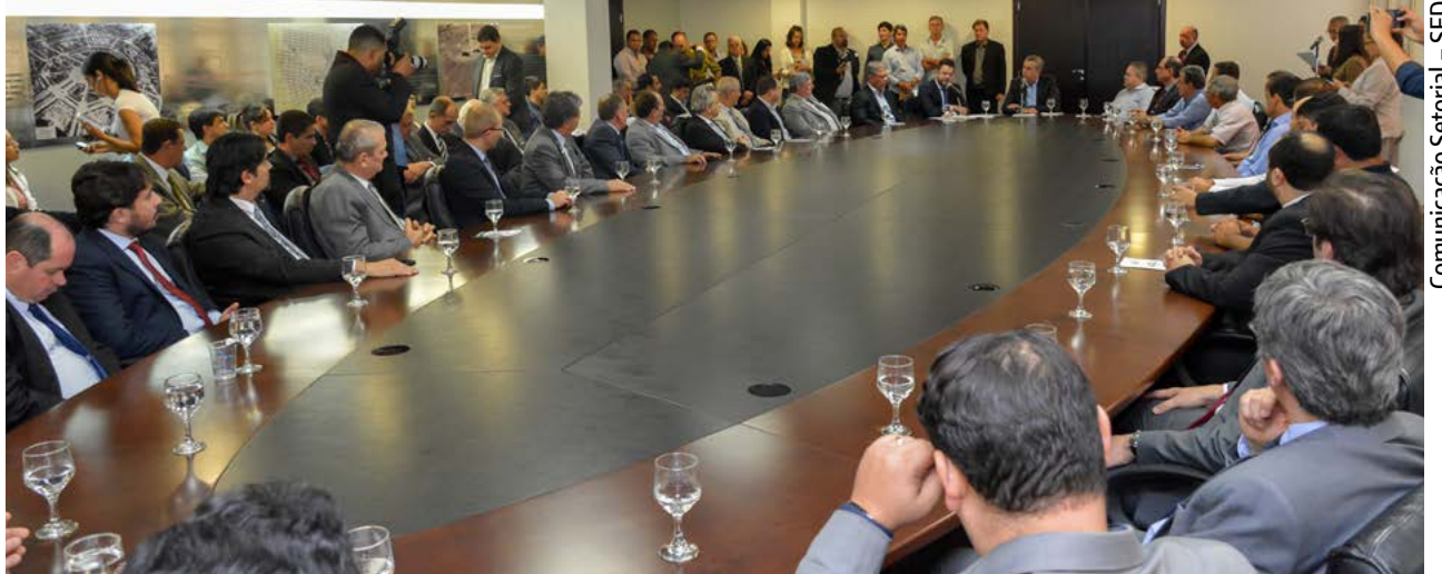
Comunicação Setorial - SED

A solenidade da assinatura dos protocolos de intenções, realizada na sala de reuniões do 10º do Palácio Pedro Ludovico Teixeira contou com as presenças, além do governador José Eliton e do secretário Leandro Ribeiro, de secretários de Estado, do deputado Manuel de Oliveira, dos representantes das empresas, dos prefeitos de Cachoeira de Goiás, Sanclerlândia, Guaporé, Santa Bárbara e do vice-prefeito de Anápolis, além de representantes de entidades de classe.