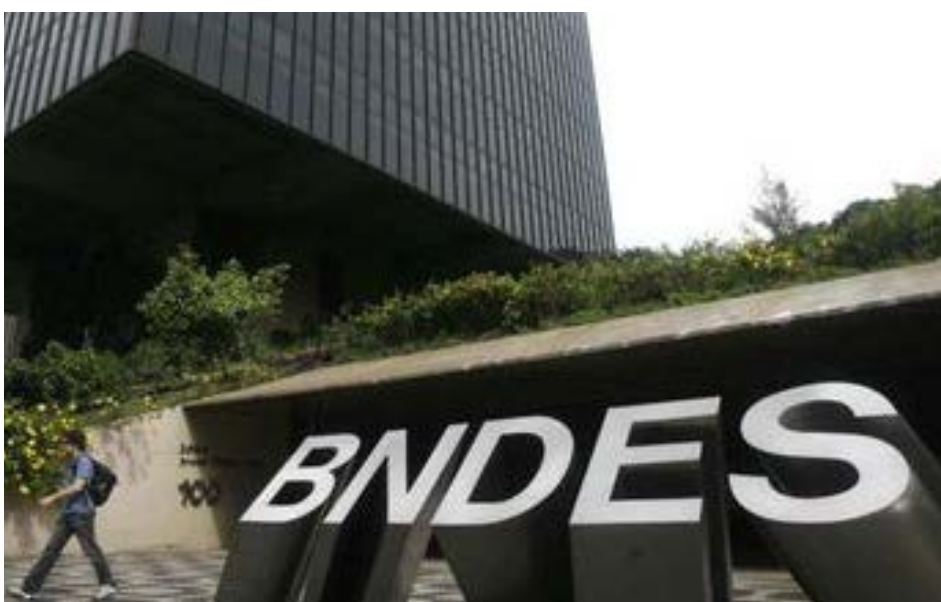
O cartão foi criado há 16 anos para apoiar as micro, pequenas e médias empresas