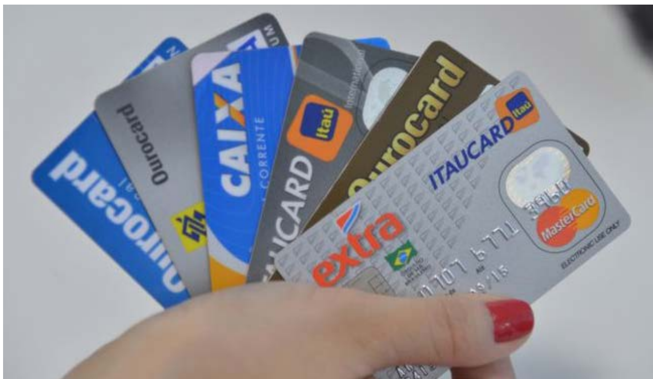
Entre os analfabetos, saldo devedor do cartão de crédito é dividido em 38% na modalidade à vista ou parcelado com o lojista

No caso do consumidor com ensino superior completo, a maior parte do