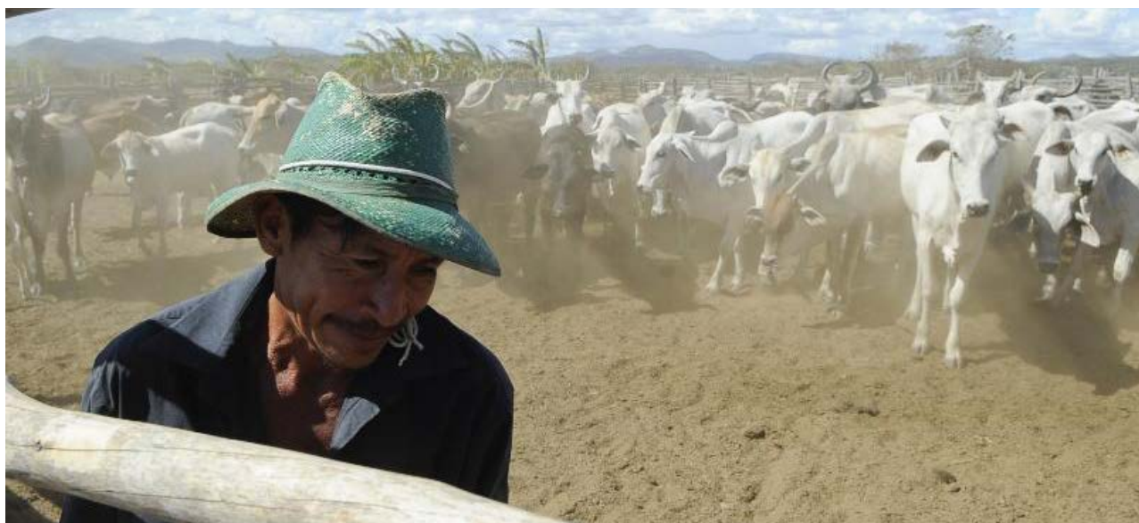
Abate de bois aumentou 3,8% em 2017, atingindo 30,83 milhões de cabeças. Mato Grosso lidera ranking com 15,6% da participação nacional

Outro desafio enfrentado pelo setor, segundo o IBGE, foi o desaquecimento na demanda interna por carne bovina, em razão da crise econômica. "Isso é mostrado pela queda nos preços de todos os cortes de carne. Enquanto o Índi-