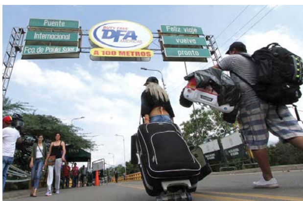
Venezuelanos têm cruzado as fronteiras com os países vizinhos

Além da medida provisória, que traz as providências de assistência