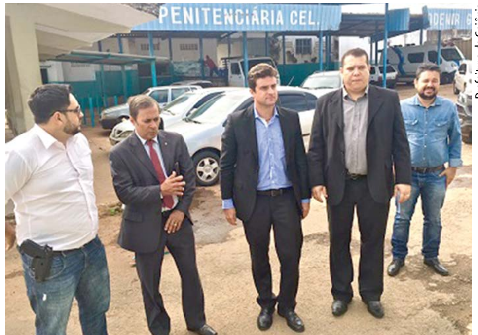
Prefeitura de Goiânia

Além desse trabalho dos presos nos parques, o presidente da Amma quer buscar também uma parceria com o setor industrial da Penitenciária Odenir Guimarães para que, na própria peniten-