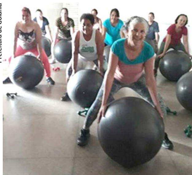
Prefeitura de Goiânia

Com o objetivo de incentivar a prática da atividade física e o convívio social em diferentes regiões da cidade, a Prefeitura de Goiânia, por meio da Agência Municipal de Esporte, Lazer e Turismo (Agetul), oferece à população goianiense a oportunidade de se exercitar com o auxílio de profissionais, por meio dos projetos Vida Ativa e Caminhando com Saúde. As iniciativas oferecem aulas supervisionadas de alongamento, ginástica localizada e funcional, ritmo, hidroginástica, cor-