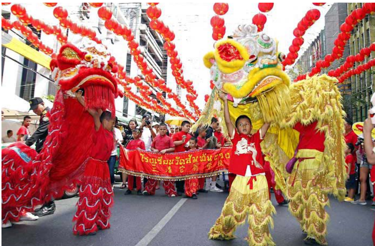
Bailarinos executam a dança do dragão como parte das celebrações do Ano Novo na China

Embora sejam um símbolo nacional, não é a primeira vez que Pequim proíbe os fogos de artifício, que foram inventados pelos próprios chineses. Em 1993, as autoridades proibiram o