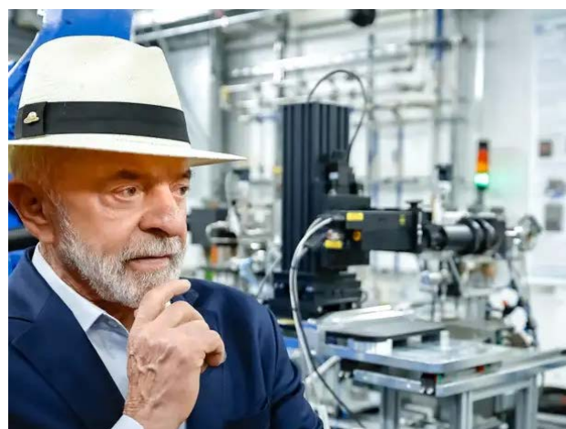
Ricardo Stuckert / JPR

Durante evento realizado em Campinas, no interior de São Paulo, Lula destacou que outros países poderão se associar ao Brasil para explorar esses recursos, dentro do território brasileiro.