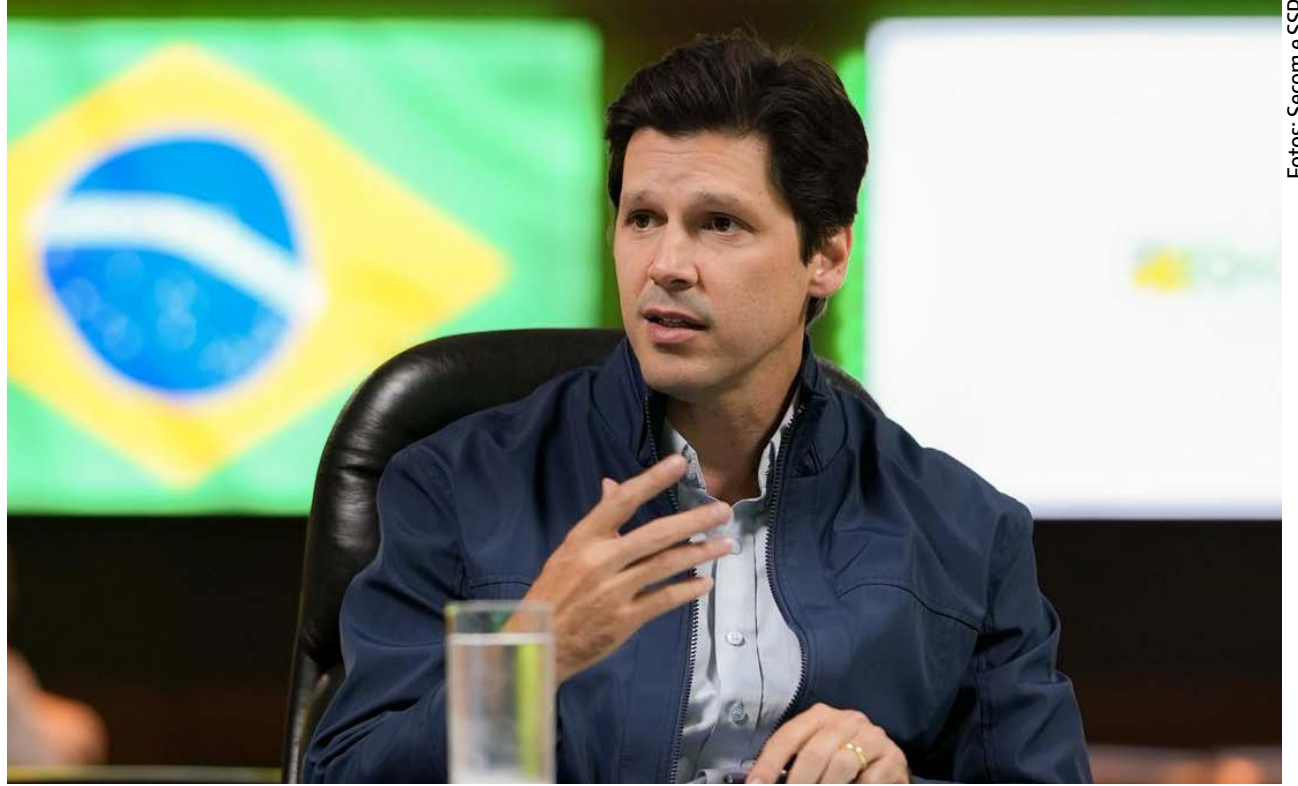
“A gente vai continuar firme e forte, garantindo que Goiás seja terra de gente de bem, onde bandido não se cria e não se criará”, declarou o governador Daniel Vilela. Operações Destroyer e Agropix miram facções criminosas e esquema de fraude eletrônica

A investigação é resultado de um trabalho contínuo de inteligência que busca desarticular uma organização criminosa voltada para a comercialização e distribuição de entorpecentes por meio de sistema de “delivery”. O grupo utilizava motocicletas e