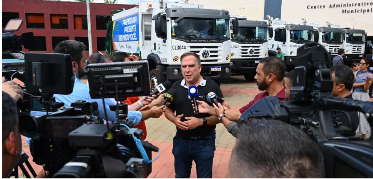
Novo contrato entre Seinfra e Comurg garantem zeladoria mais eficiente e com mesmo custo ao contribuinte

O documento de mais de 3,6 mil páginas, estruturado em seis anexos técnicos, detalha o novo contrato, com valor total estimado de R$ 7,2 bilhões para 60 meses (cinco anos), que representa um teto orçamentário máximo. A Prefeitura só pagará