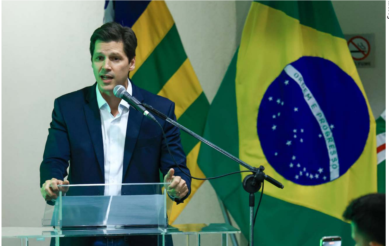
Goiás em Movimento atende demandas das prefeituras por obras em vias urbanas