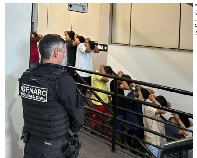
Operação Destroyer tem caráter permanente: combate ao crime é prioridade para o Governo de Goiás

trabalho não cessará até que tenhamos eliminado todas as facções, pequenas ou grandes, em território goiano”, afirmou. A primeira etapa da Destroyer teve início em 2023, com 123 operações deflagradas e 228 investigações concluídas e remetidas ao Poder Judiciário. Já a segunda etapa, com monitoramento em nível de inteligência estratégica, teve início