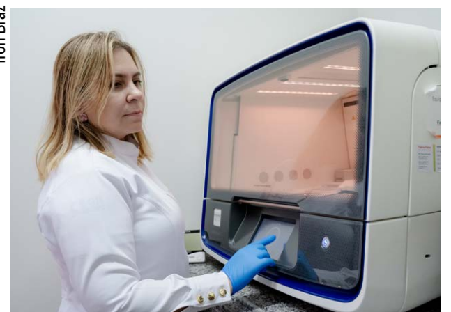
Profissional realiza preparo e manipulação de amostras em laboratório, etapa essencial para o sequenciamento genético que contribui para o diagnóstico precoce do câncer de mama no SUS

sileira, especialmente da Faculdade de Medicina, na incorporação de novas tecnologias”, destaca.