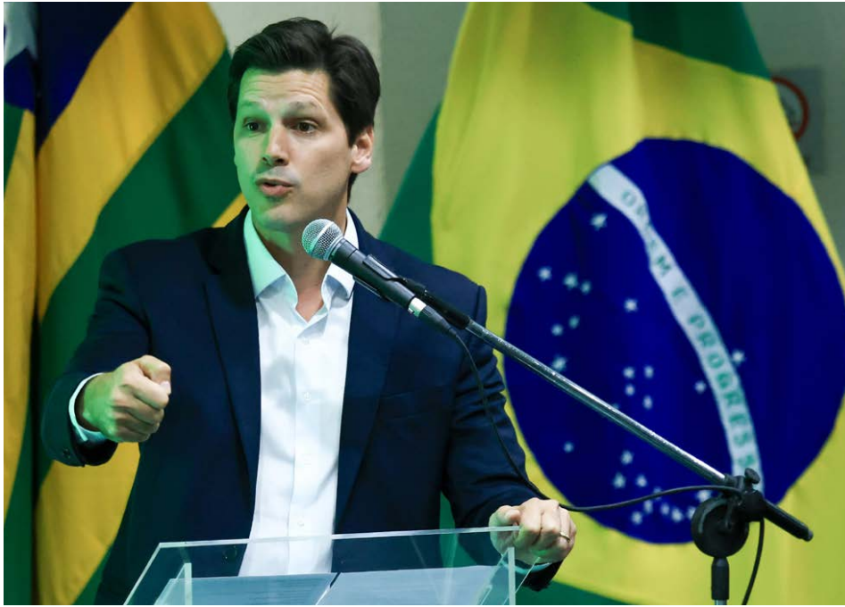
Governador Daniel Vilela lança nova etapa do Programa Goiás em Movimento Municípios com investimentos de R$ 165 milhões com obras em 126 municípios

Recurso é aplicado na conservação e sinalização de ruas e avenidas indicadas por administrações municipais. “A gente licita, executa e paga esse programa”, explica o governador