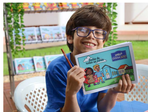
De 14 a 17 de abril, Uruaçu, Barro Alto, Vila Propício e Padre Bernardo recebem primeira etapa do Cine Leitura do Bem,

O acervo do Cine Leitura do Bem reúne obras da literatura goiana e brasileira, clássicos infantojuvenis, títulos de historiografia e poesia goiana, além de histórias em quadrinhos. A programação inclui ainda sessões de contação