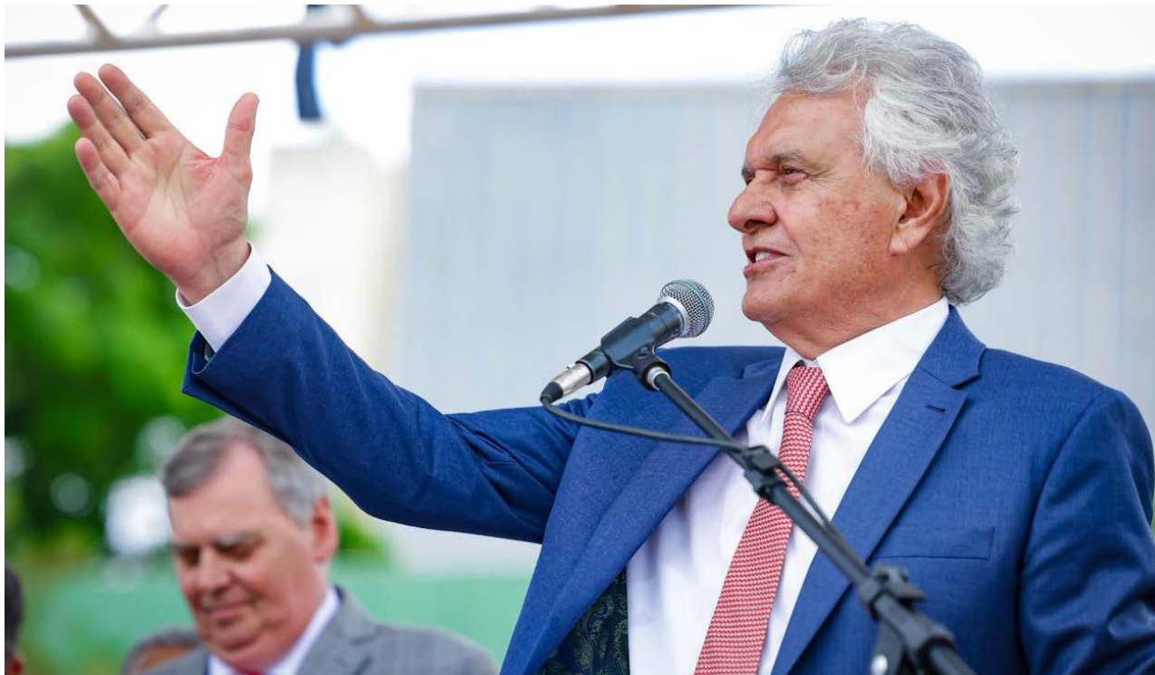
Caiado entrega novos helicópteros à Polícia Militar e à Polícia Civil

O vice-governador Daniel Vilela citou que responsabilidade fiscal e valorização das polícias foram algumas das ações promovidas pela atual gestão que levaram à queda consecutiva dos principais índices de criminalidade. “Temos uma polícia preparada, equipada, bem remunerada e altamente qualificada para desempe-