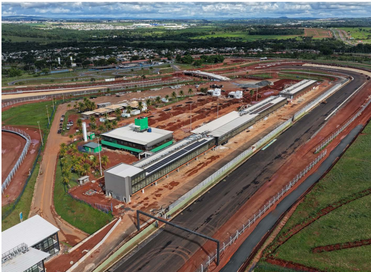
Obras do Autódromo Internacional de Goiânia estão quase concluídas para receber Grande Prêmio do Brasil de MotoGP

As demais intervenções também estão na fase final. A pista principal, com 3.825 metros de extensão, foi totalmente reconstruída e já está 100% pavimentada. Na primeira etapa, foi aplicada uma camada de concreto betuminoso usinado a quente (CBUQ), que funciona