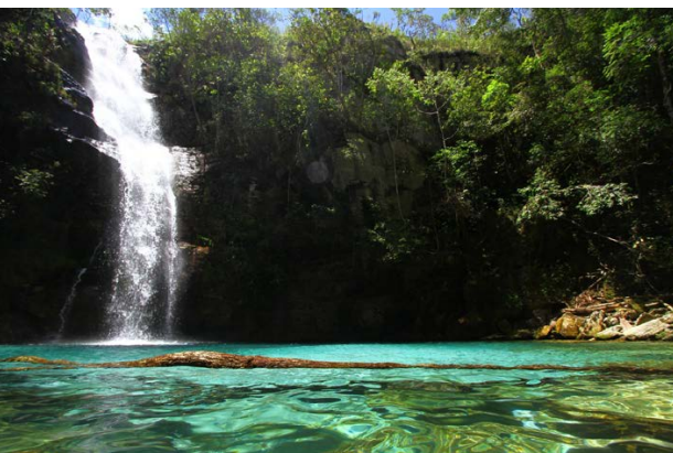
Goiás se consolida como destino turístico no país, como o caso da Cachoeira Santa Bárbara, em Cavalcante