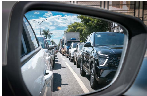
IPVA 2026 pode ser pago até dia 15 de janeiro com 8% de desconto

Para emitir o boleto ou documento único de arrecadação (DUA), o contribuinte deve acessar o Portal Expresso ( https://www.go.gov.br/ ) ou o site do Detran-GO ( https://goias.gov.br/detran/ ), clicar no serviço “Consultar Veículo – IPVA, Multas e CRLV” e seguir os passos. Outras opções de acesso são o aplicativo para smartphone Detran GO ON ou buscar atendimento em uma unidade do Vapt Vupt.